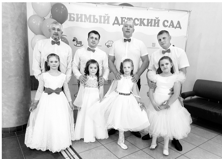
Участники танца с папами