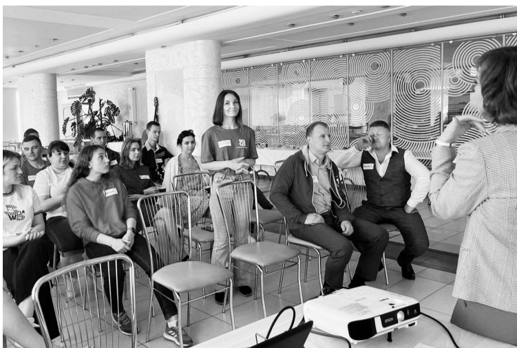
Деловая игра в самом разгаре

3 июля для молодых работников АО «Соликамскбумпром» прошёл тренинг «Бумеранг. Перегрузка!» Прокатка лидерских навыков, обмен опытом с лидерами молодёжного объединения предприятия, стратегические игры на сплочение и активизацию навыков принятия нестандартных управленческих решений — наполнение встречи было крутым и интересным.