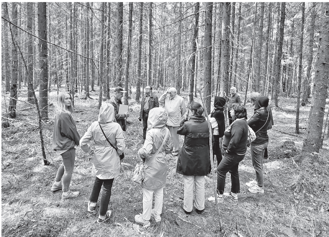
На площадке в Лисинском учебно-опытном лесхозе СПБЛГТУ

На пленарном заседании конференции были представлены доклады «Лесной комплекс