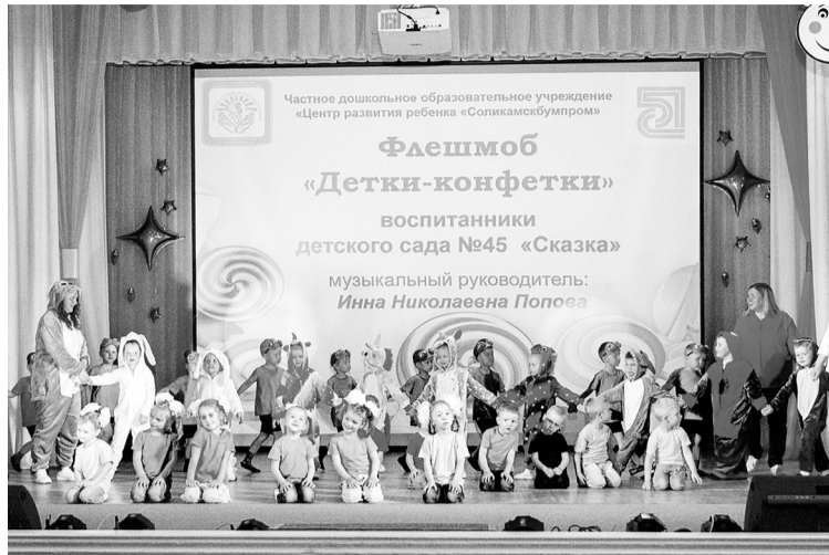
На сцене самые маленькие «конфетки»

— Вы любите конфеты? Они вкусные. А мы, взрослые, любим своих детей, потому что они сладкие как конфетки. Детское счастье в сладостях и конфетах, а наше счастье — в глазах любимых детей, — так начался отчётный концерт воспитанников Центра развития ребёнка «Соликамскбумпром».