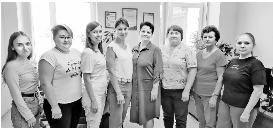
Делопроизводство предприятия в надёжных руках

В любой организации независимо от её деятельности создаётся большое количество документов. С их гигантским потоком умело управляются в отделе управления делами и делопроизводстве. В августе этого года коллектив отдела отмечает свой двадцатилетний юбилей.