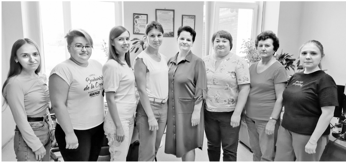
Делопроизводство предприятия в надёжных руках

В любой организации независимо от её деятельности создаётся большое количество документов. С их гигантским потоком умело управляются в отделе управления делами и делопроизводстве. В августе этого года коллектив отдела отмечает свой двадцатилетний юбилей.