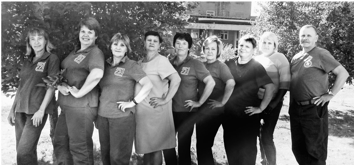
Совет от ОУДиД: На работу надо ходить только с хорошим настроением!