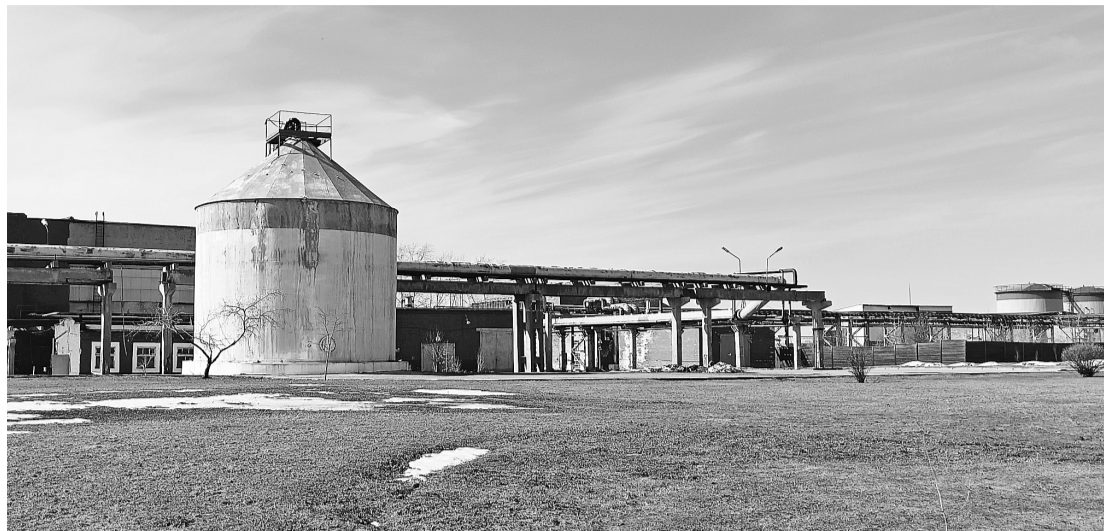
Весенний пейзаж с баком раствора соды

Коллектив содоразводки длительное время не менялся. Но летом прошлого года в связи с выходом на пенсию одного работника участка и сменой работы другого коллектив обновился. Новички прошли стажировку у опытных