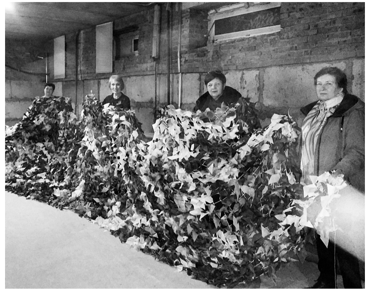
Волонтеры с готовой маскировочной сетью

В настоящее время открыт первый пункт плетения маскировочных сетей по адресу: улица Дубравная, дом 51 (ТОС «Дубрава»). Присоединиться к волонтерам могут все неравнодушные соликамцы.