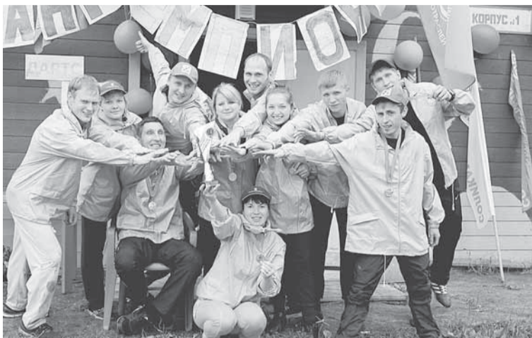
Девиз «Бумеранг» — «Вкус победы нам по вкусу!»

— Ежегодно пермский краевой комитет отраслевого профсоюза организует слёт профсоюзного актива для предприятий лесной отрасли. В этом году члены молодёжного объединения «Бумеранг» откликнулись на приглашение и приняли участие в туристическом слёте, организованном на базе