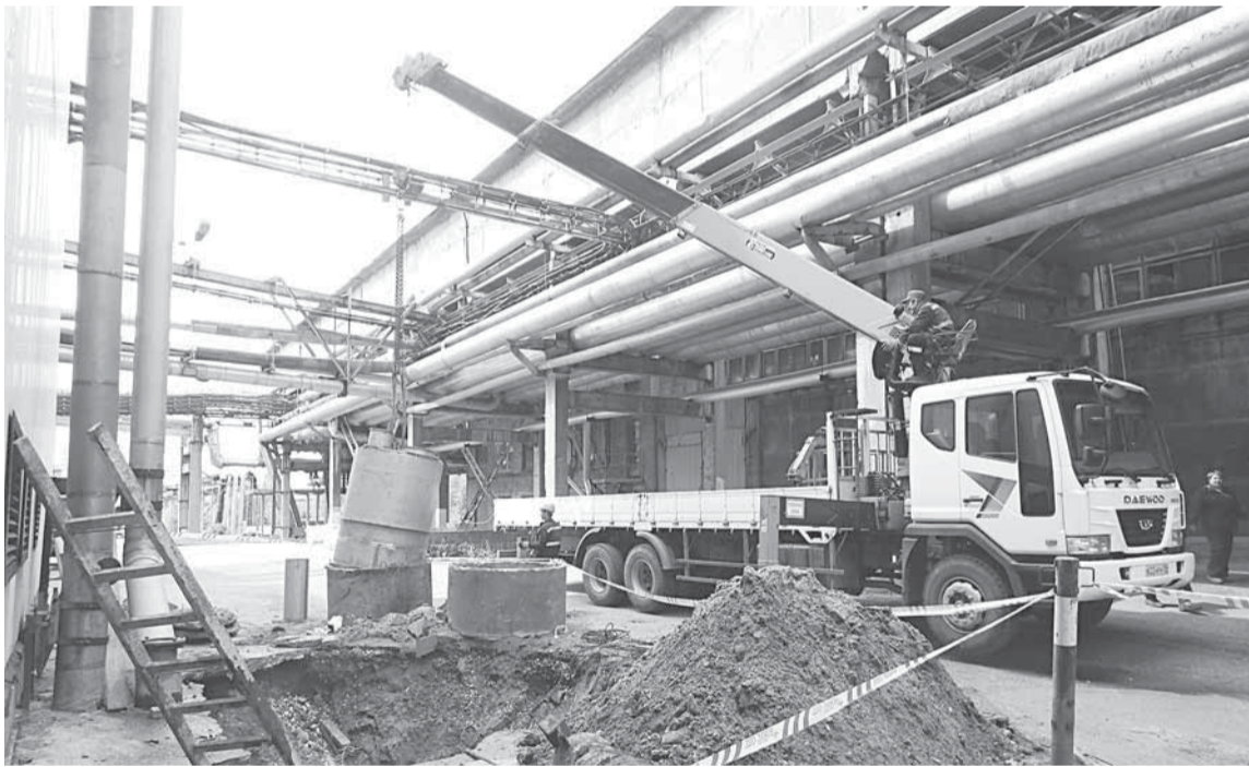
Фото № 1.

В ПЛАНОВЫЙ ОБЩИЙ ОСТАНОВ ПРЕДПРИЯТИЯ ПРОДОЛЖИЛСЯ РЕМОНТ ПРОИЗВОДСТВЕННОЙ КАНАЛИЗАЦИИ. ПРОЕКТ РЕМОНТНЫХ РАБОТ БЫЛ РАЗРАБОТАН НА ОСНОВАНИИ РЕЗУЛЬТАТОВ ОБСЛЕДОВАНИЯ КОЛЛЕКТОРА ОРГАНОПОТОКА, ПРОВЕДЁННОГО В ОСТАНОВ 2013 ГОДА.