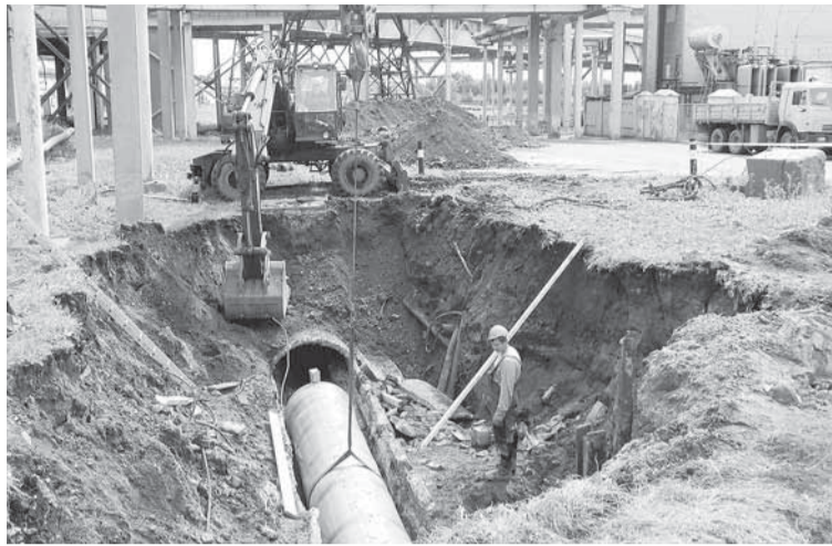
Фото № 2.

Даже в мыслях сменить род трудовой деятельности никогда у него не было. За «баранкой» он почти 35 лет