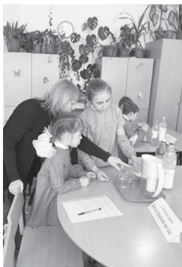
Эксперименты с фильтрацией воды.

Вторая муниципальная школьная научно-практическая конференция по экологии, организованная при поддержке АО «Соликамскбумпром», завершилась бумажной парусной регатой.