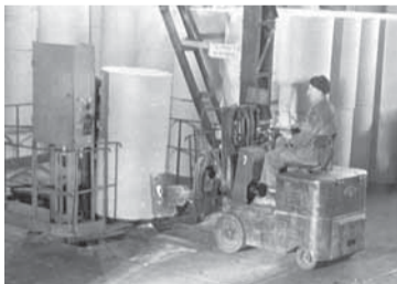
Склад. Примерно 60-е гг.

В те времена отгрузка продукции осуществлялась в основном вагонами по железной дороге. Загружали вагоны водители погрузчиков СППЖТ (сейчас это ОАО «Транспорт»), контроль над погрузкой и приёмкой бумаги осуществляли кладовщики склада. Кладовщики делали приёмку бумаги, находясь всю смену у кантователя вместе с водителем. Вручную переписывали данные с этикеток рулонов в отвесы для ведения остатков и отчетности, на пишущих машинках заполняли документы после отгрузки, умело считали на счетах.