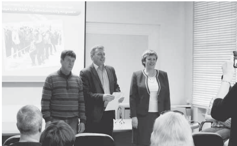
Награды и фото на память.

Если спортивные мероприятия проводятся чаще, то появляется всё больше желающих в них участвовать. И профком АО «Соликамскбумпром» организовал в юбилейный год, кроме традиционно проводимых спортивных мероприятий, спартакиаду.