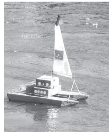
Парусу «Соликамскбумпрома» попутного ветра!

уже второй год подряд мы становимся организаторами детской экологической конференции. Сегодня особенно важно воспитывать экологическую ответственность уже с детского возраста, и такие форумы дают хорошую возможность всем участникам рассказать о своих исследованиях и обсудить проблемные