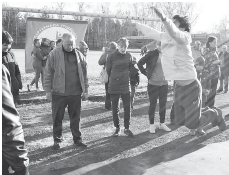
Чей прыжок будет дальше всех?

Это неслучайно. Спортивные традиции всегда были сильны в трудовых коллективах предприятия. И сегодня, бумажники предпочитают отдыхать активно, занимаясь бегом, играя в футбол, хоккей, настольный теннис... Часто