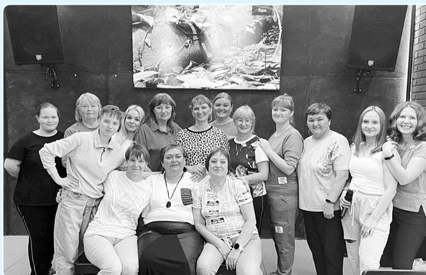
Коллектив лаборатории ЦП

— Санитарно-промышленная лаборатория занимается контролем воздушной среды и промышленных стоков. Наша группа занимается анализом эффективности очистки промышленных стоков в цехе очистных сооружений. Ежедневно мы производим бактериологический анализ активного ила, индикаторную оценку процесса биологической очистки, контроль физиологического состояния микроорганизмов. Самая ответственная и самая важная точка контроля — лоток очищенных сточных вод перед выходом в реку Каму!