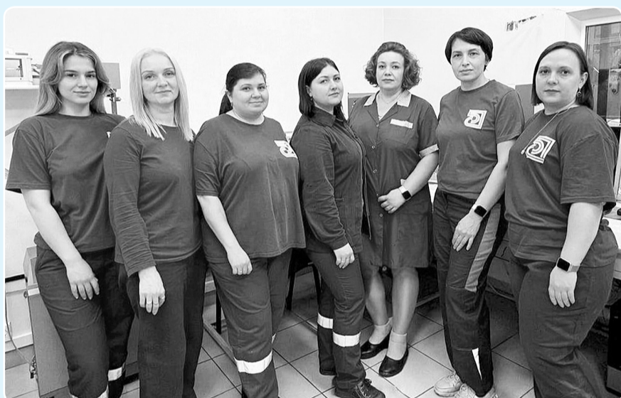
Коллектив лаборатории БП №2,3

— Определением качества полуфабрикатов целлюлозы, древесно-дефибрной массы и термомеханической массы занимаются лаборатории целлюлозного и древесно-массного производств. Контроль ведётся круглосуточно — лаборанты делают отбор проб по определению качества. Из волокна на специальном аппарате изготавливаются отливки, испытывая которые мы определяем механические и оптические свойства произведенных в цехе полуфабрикатов.