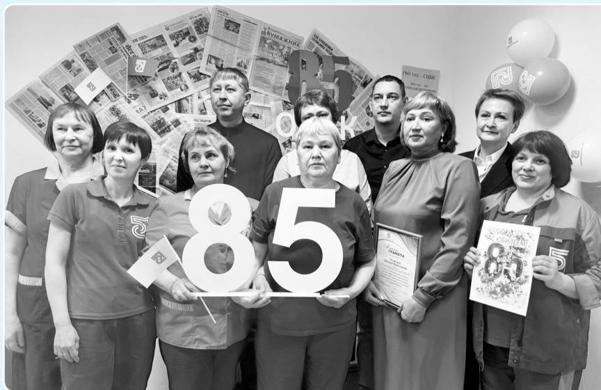
Коллектив лаборатории ДМП

— Поступающие на предприятие сырьё, материалы, химикаты обязательно проверяются в лаборатории ЛТВК на соответствие сертификатам качества, чтобы предотвратить запуск в производство некачественной продукции. Номенклатура материалов, химикатов, проходящих через лабораторию, огромная. Мы задействованы на всех этапах текущего контроля. Кроме того, через лабораторию проходят экспериментальные пробы химикатов и опытные образцы материалов, которые производители предлагают к использованию в производстве.