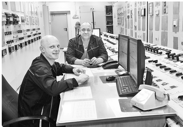
На центральном тепловом щите