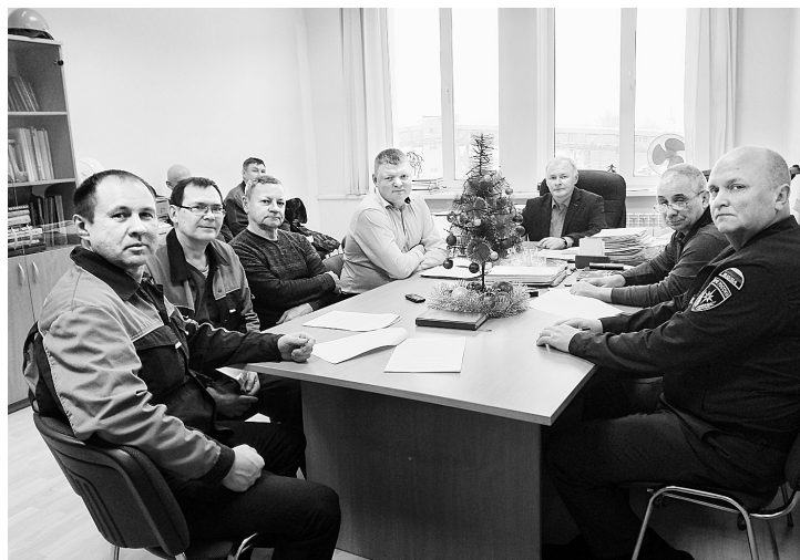
Начальники служб на совещании

Кроме того, на ТЭЦ продолжается обновление насосного парка: в январе будет осуществлена поставка питательного насоса, который «придёт» на смену выработавшему свой ресурс.