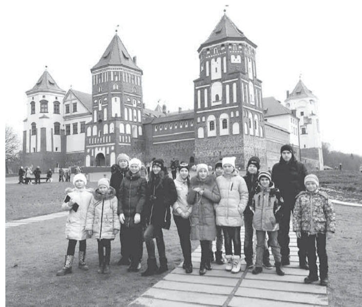
На фоне величественного Мирского замка.

Яркие впечатления, множество фотографий с памятных исторических мест, новые друзья — с таким замечательным «багажом» 25 мальчишек и девчонок вернулись с осенних каникул в Беларуси. Организовал поездку для детей бумажников профком предприятия.