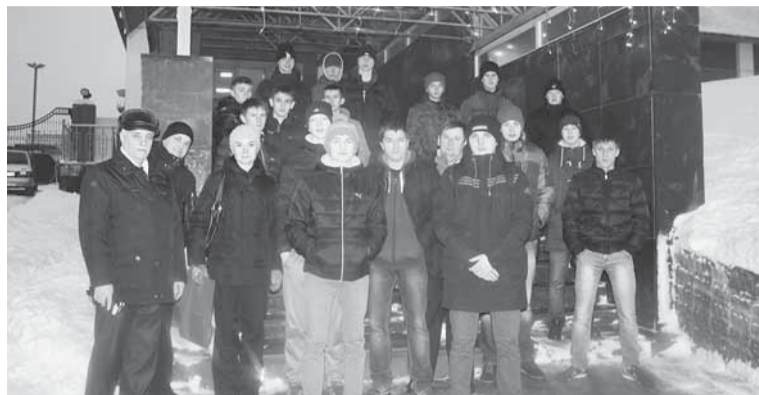
Молодёжь идёт на предприятие.

Накануне Всемирного дня молодёжи, который отмечается 10 ноября, мы расскажем читателям о молодых специалистах нашего предприятия и будущих бумажниках, которые сегодня учатся в вузах и ссузах.