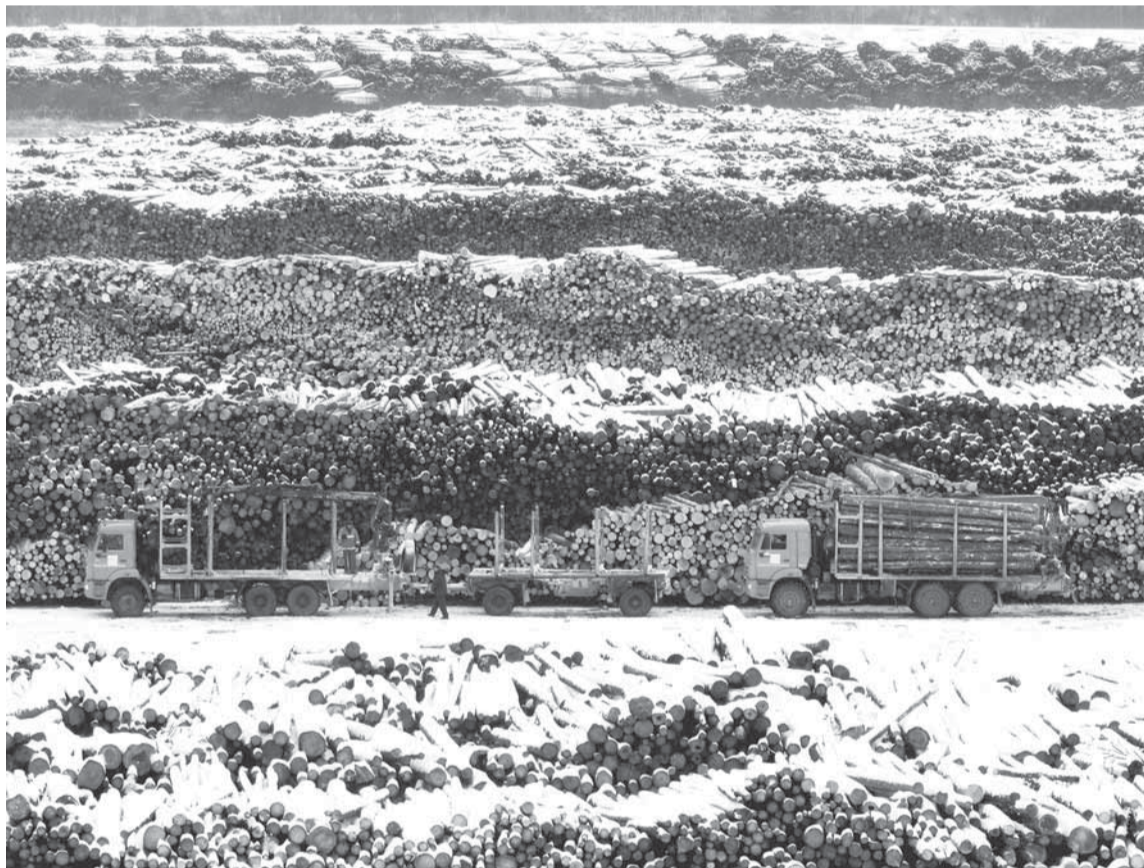
Запасы древесины — гарантия стабильной работы предприятия.

ДЛЯ КОЛЛЕКТИВА ЛЕСОСЫРЬЕВОГО ПРОИЗВОДСТВА САМОЕ ГОРЯЧЕЕ ВРЕМЯ — ПЕРИОД НАВИГАЦИИ — ОСТАЛОСЬ ПОЗАДИ. А ЭТО ЗНАЧИТ, ЧТО ИМЕННО СЕЙЧАС МОЖНО ПОДВЕСТИ ИТОГИ И РАССКАЗАТЬ О ТОМ, КАКИЕ ЗАДАЧИ НЕОБХОДИМО РЕШИТЬ ДО НАСТУПЛЕНИЯ НОВОГО ПАВОДКА.