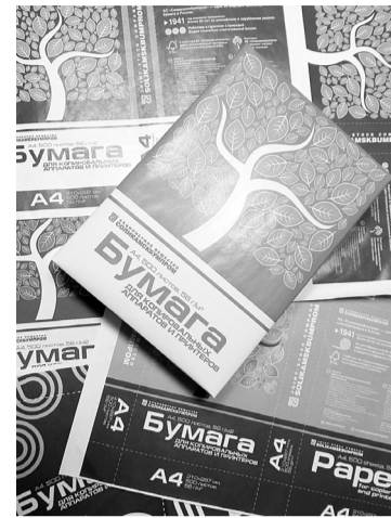
Варианты дизайна упаковки нового продукта

— Работа ООО «СОПАПЭКС» очень тесно связана с работой многих служб предприятия. Им, как и нам, также пришлось проделывать не малую работу по изучению и продвижению новой продукции. Кроме того, московское представительство в последние годы пополнилось новыми молодыми кадрами. И этой осенью АО «Соликамскбумпром» принял на обучение две группы специалистов ООО «СОПАПЭКС». Для этого была разработана и утверждена специальная программа обучения, проводили занятия непосредственно на производстве опытные специалисты из ОЛТК, целлюлозного производства, отдела стандартизации, ЦОП. Важно, чтобы менеджеры, которые работают в представительстве АО «Соликамскбумпром», имели полное представление о технологической цепочке, процессах производ-