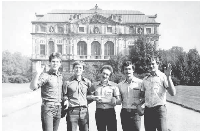
Привет из Германии родным и друзьям!

Предшествовали появлению этой даты в календаре трагические события. Он был учреждён в 1941 году на международной встрече студентов стран, борющихся против фашизма. Дата установлена в память о погибших чешских студентах-патриотах.