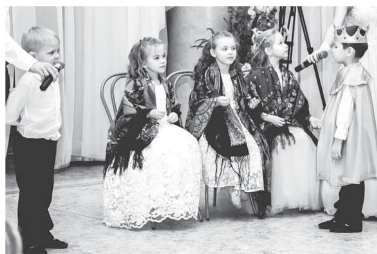
Три девицы под окном...

Каблук-носок, каблук-носок, Галопом скачем и подскок! Под известную песенку