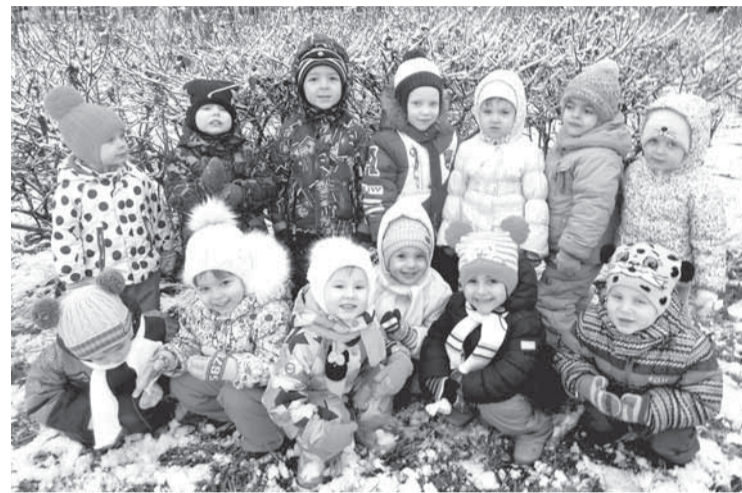
В здоровом теле — здоровый смех!

Под таким названием в младшей дошкольной группе «Капелька» детского сада № 45 «ЦРР «Соликамскбумпром» прошла неделя здоровья.