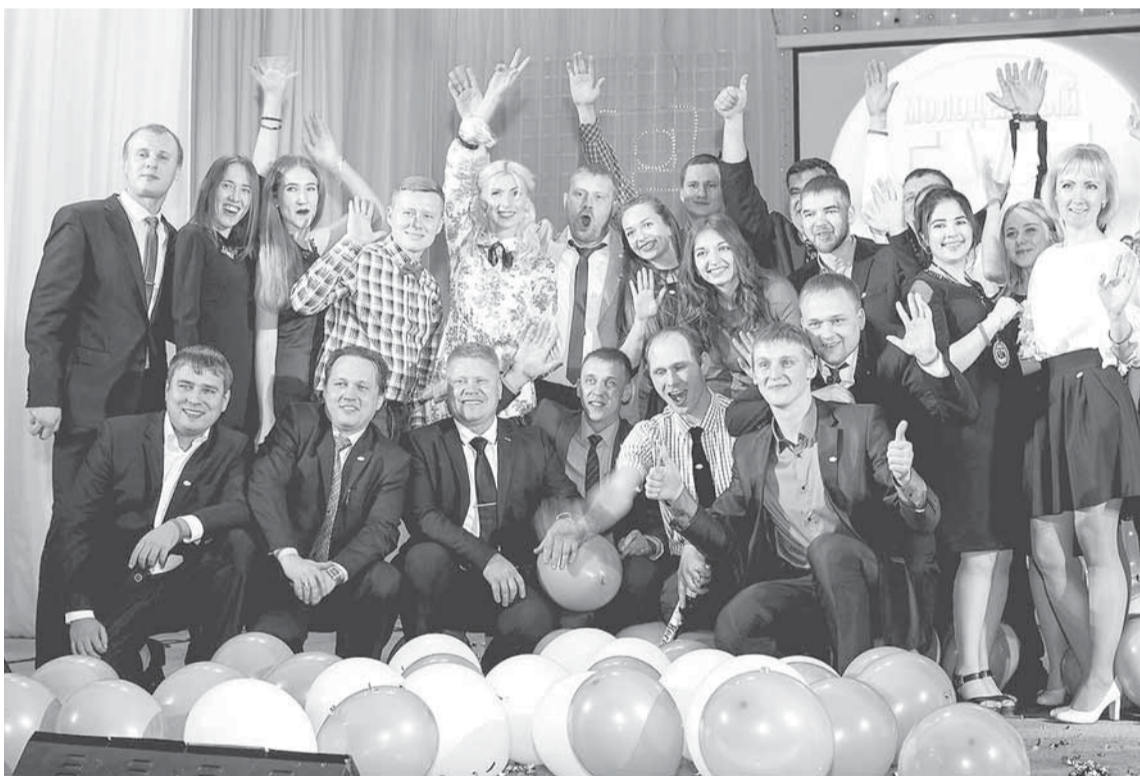
«Бумеранг» — вместе 10 лет!

ИСКРОМЁТНЫЕ ШУТКИ ВЕДУЩЕГО, ИНТЕРЕСНЫЕ ГОСТИ, НЕПЕРЕДАВАЕМАЯ АТМОСФЕРА И ОБСУЖДЕНИЕ АКТУАЛЬНЫХ СОБЫТИЙ. НЕТ, ЭТО НЕ ШОУ «ВЕЧЕРНИЙ УРГАНТ», ЭТО «ВЕЧЕРНИЙ БУМ» — ПЯТНИЦА, 17 НОЯБРЯ, МЫ НАЧИНАЕМ!