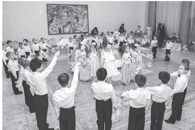
Осенняя пора — очей очарованье.

А вы знаете, что 16 ноября в Доме культуры «Бумажник» состоялся первый в городе литературный бал для дошколят, посвящённый творчеству Александра Сергеевича Пушкина?