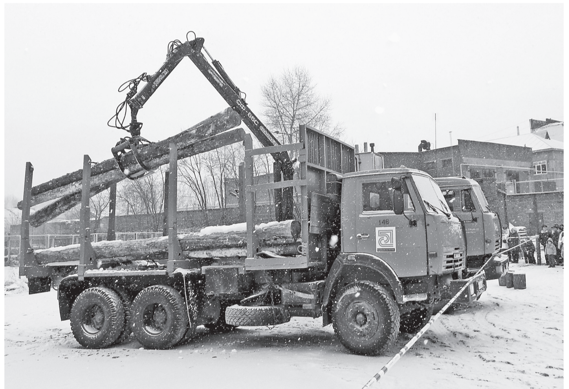
На конкурсе профмастерства 2015 года

В последнее воскресенье октября отмечают свой профессиональный праздник водители, механики, инженерно-технические работники и другие сотрудники, руководители автотранспортных предприятий. В АО «Соликамскбумпром» ждут поздравления с Днём работника автомобильного транспорта четыре структурных подразделения — автолесовозный и автотранспортный цеха, цех по перевозке древесины в ОСП «Вишера» и ОСП «Кудымкар».