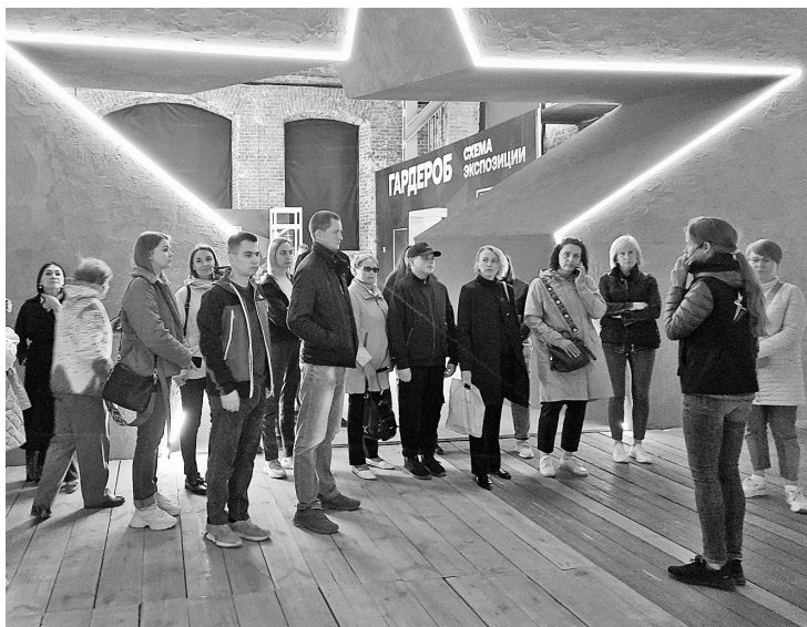
Бумажники на экскурсии

В рамках патриотического фестиваля, проходящего на территории культурно-рекреационного пространства завода имени А.А. Шпагина, соликамскими бумажниками была организована информационная площадка с лекцией о жизни Соликамска в годы Великой Отечественной войны. Слушателями лекции стали почти 70 человек — пермские школьники и преподаватели, многочисленные гости и посетители выставки. Среди них и работники Соликамскбумпром, члены молодёжного объединения «Бумеранг», участ-