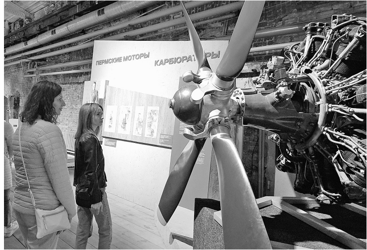
Авиамотор АС-82, изделие моторостроительного завода №19