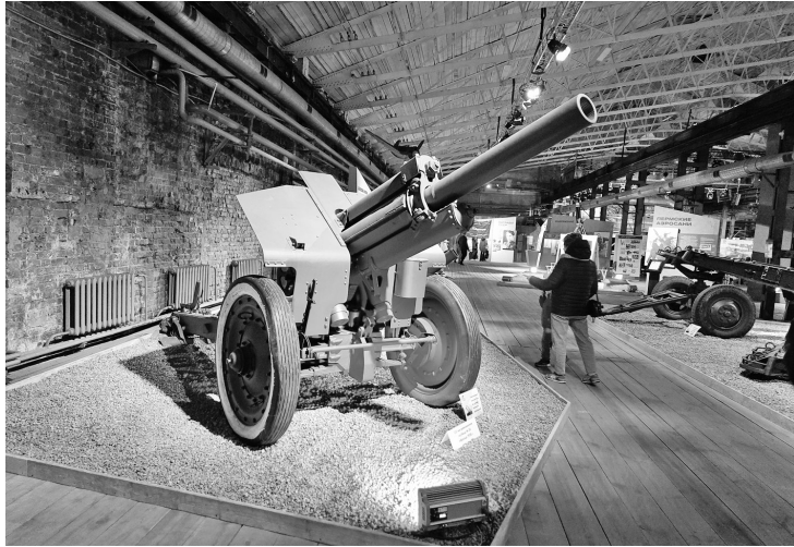
122-мм дивизионная гаубица М-30 образца 1938 г.