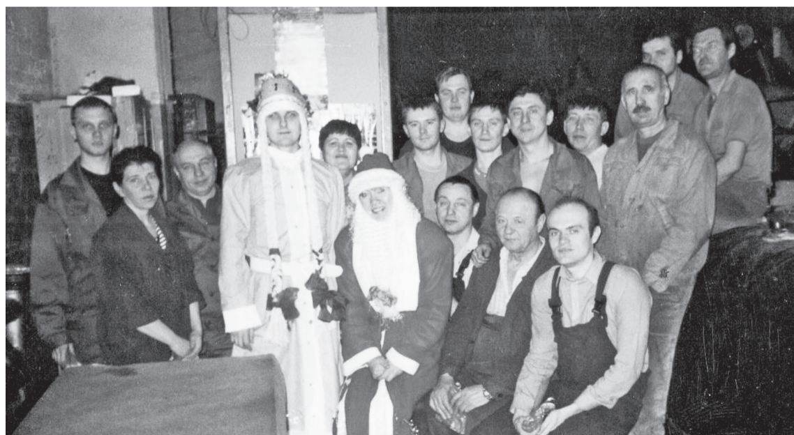
Однажды под Новый год в шлифовальном