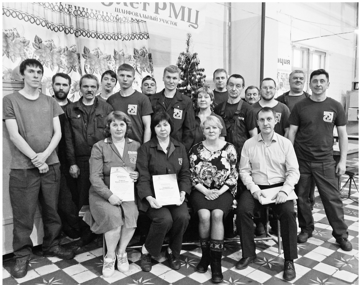
Фото на память в шлифовальном участке у новогодней ёлки в 80-летний юбилей цеха

С первых дней работы цеха здесь занимались ремонтом, изготовлением запасных частей и нестандартным оборудованием. В самом начале было несколько металлообрабатывающих, токарных, фрезерных станков и небольшой кузнечный участок. Постепенно парк станков расширялся, модернизировался, открывались всё новые участки, осваивались новые технологии. Так появилось литейное отделение, модельный участок, участок узловой сборки и инструментальный. Можно сказать, что со временем цех «оброс» разнопрофильными участками, сформировал штат мастеров своего дела, накопил уникальный опыт по изготовлению запасных частей для сложного бумагоделательного оборудования. И сегодня ни один ремонт,