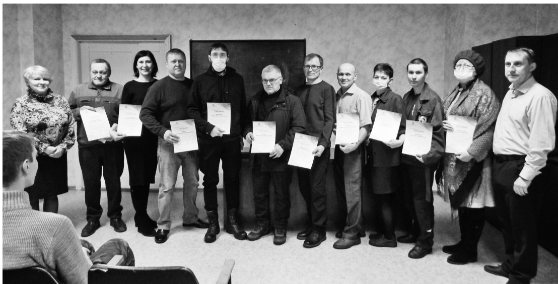
Церемония награждения в красном уголке РМЦ

Чувствовались и торжественность, и радость встречи. С приветственным словом к работникам цеха обратился