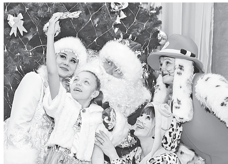
Не за горами прощание с годом собаки!

— ДК «Бумажник», наверное, раньше всех начинает готовиться к Новому году. Что подготовили сотрудники Дворца