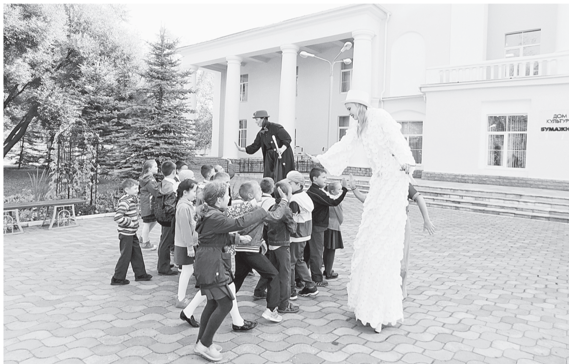
Новое полюбившееся мероприятие в начале учебного года для детей и всей семьи — ПервоКЛАСный БУМ.

В ДК «Бумажник» стало больше гостей, что, конечно, приятно всему коллективу КСЦ. Ведь мы работаем для людей! В 2019 году с февраля по апрель планируем вновь провести музыкальный сезон. Мы предлагаем купить абонемент, то есть билеты сразу на три концерта. Кстати, это нововведение очень нравится зрителям.