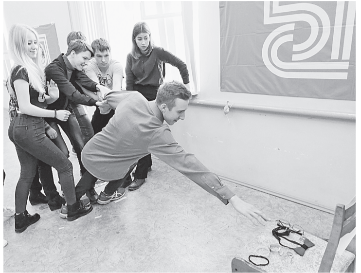
Тренинг на командообразование помог сплотиться и проявить свои лучшие качества

Именно так называется профориентационный проект, который реализуют специалисты группы по обучению и развитию персонала отдела кадров АО «Соликамскбумпром» совместно с молодёжным объединением «Бумеранг». На этот раз в проекте участвовали студенты I и II курсов УГЛТУ.