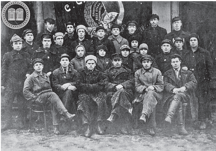
Актив Соликамской городской ячейки ВЛКСМ. Ноябрь 1927 г.

Кажется, что ещё совсем недавно аббревиатуры РКСМ, РЛКСМ и тем более ВЛКСМ не требовали расшифровки. Но время летит неумолимо быстро, и вот уже дети последних комсомольцев достигли возраста вступления в ряды Союза молодёжи. В этом году исполняется 100 лет со дня образования комсомольской организации.