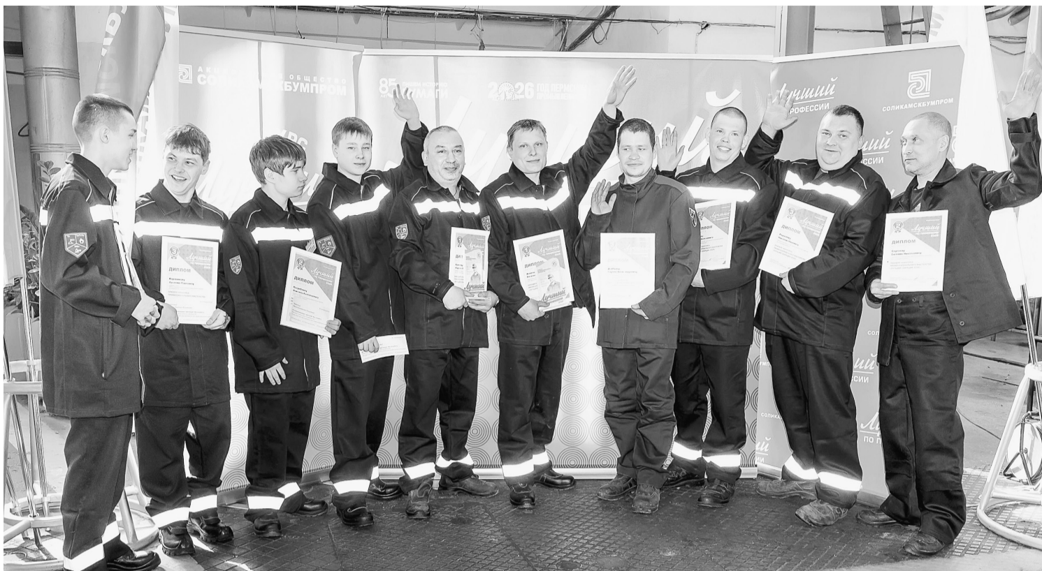
Победители и участники конкурса «Лучший по профессии «Сварщик»-2026»

В АО «Соликамскбумпром» состоялся конкурс профессионального мастерства среди сварщиков. В этом году мероприятие приурочено к 85-летию предприятия и Году Пермской промышленности. По традиции в состязаниях приняли участие не только работники Соликамскбумпром, но и студенты — в этот раз на площадку вышли обучающиеся второго курса Соликамского автомобильно-промышленного колледжа. Для каждого участника конкурс стал возможностью испытать себя, обменяться опытом с коллегами, получить новые знания, умения и навыки.