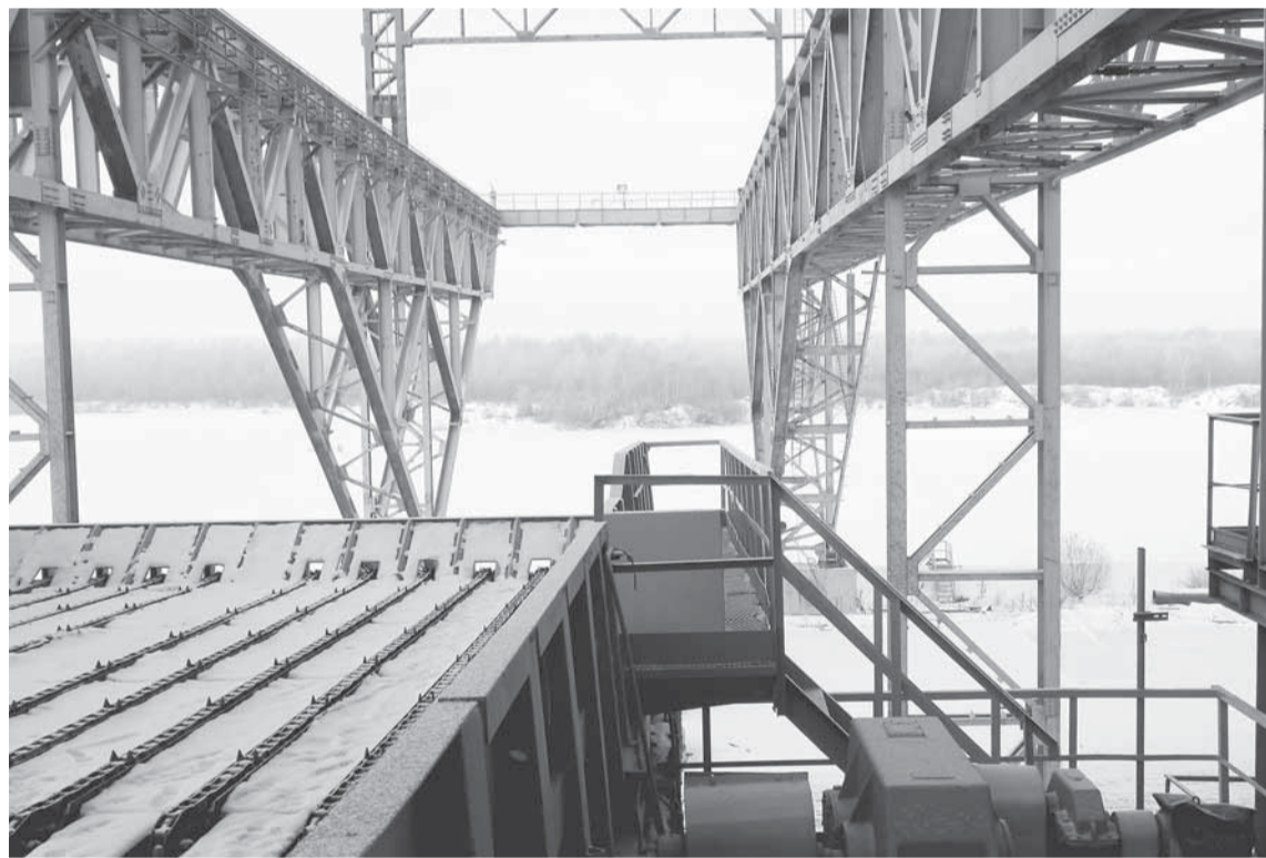
Вид с третьего слешера на покрытый льдом затон.

ВРЕМЯ ДЕЙСТВИТЕЛЬНО ЛЕТИТ. КАЖЕТСЯ, СОВСЕМ НЕДАВНО ЛЕСОСЫРЬЕВОЕ ПРОИЗВОДСТВО ГОТОВИЛОСЬ ПРИНИМАТЬ ПЕРВЫЕ ПЛОТЫ. И ВОТ УЖЕ АКВАТОРИЯ ЗАТОНА СКОВАНА ЛЬДОМ. СЕЗОН НАВИГАЦИИ ЗАКОНЧИЛСЯ.