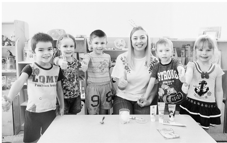
Юные участники эксперимента теперь знают всё о зубах!

Одна неделя целенаправленной работы в данном направлении, конечно, не решит всех проблем. Но значительно поможет дать детям необходимые знания о гигиене полости рта, овладеть элементарными умениями и навыками в правильном уходе за зубами, развить у дошкольников самостоятельность и ответственность. Ребятам пришли на помощь познавательные беседы «Здоровые зубы здоровью любви»; «Полезная и вредная еда для наших зубов». Свои знания дети закрепили в дидактических играх: «Здоровье из корзинки», «Как беречь зубы», «Да или