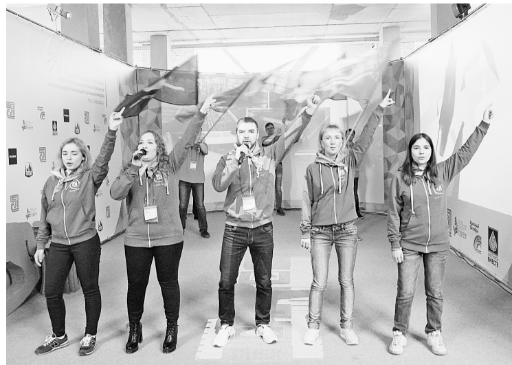
Яркое выступление «Бумеранга» на открытии Молодёжной площадки конференции

Заявленные в докладах темы получили своё развитие во время работы круглых столов и мастер-классов.