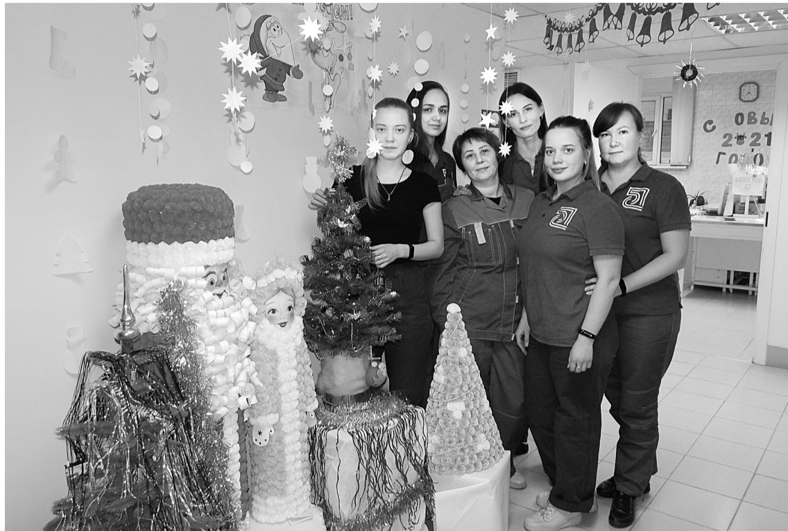
Новогодняя фотозона и её авторы

Счастье в душе, хорошее настроение не зависит от чего-либо или от кого-либо. Желание радоваться заложено в нас с рождения и потому, мы сами можем его создавать.