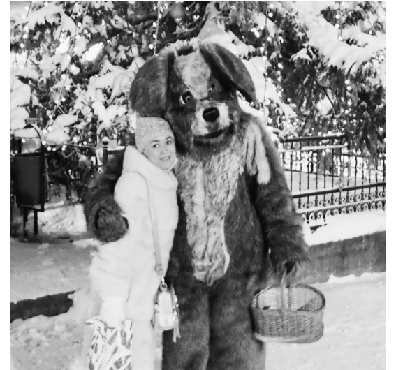
Наша любимая собака-обнимка