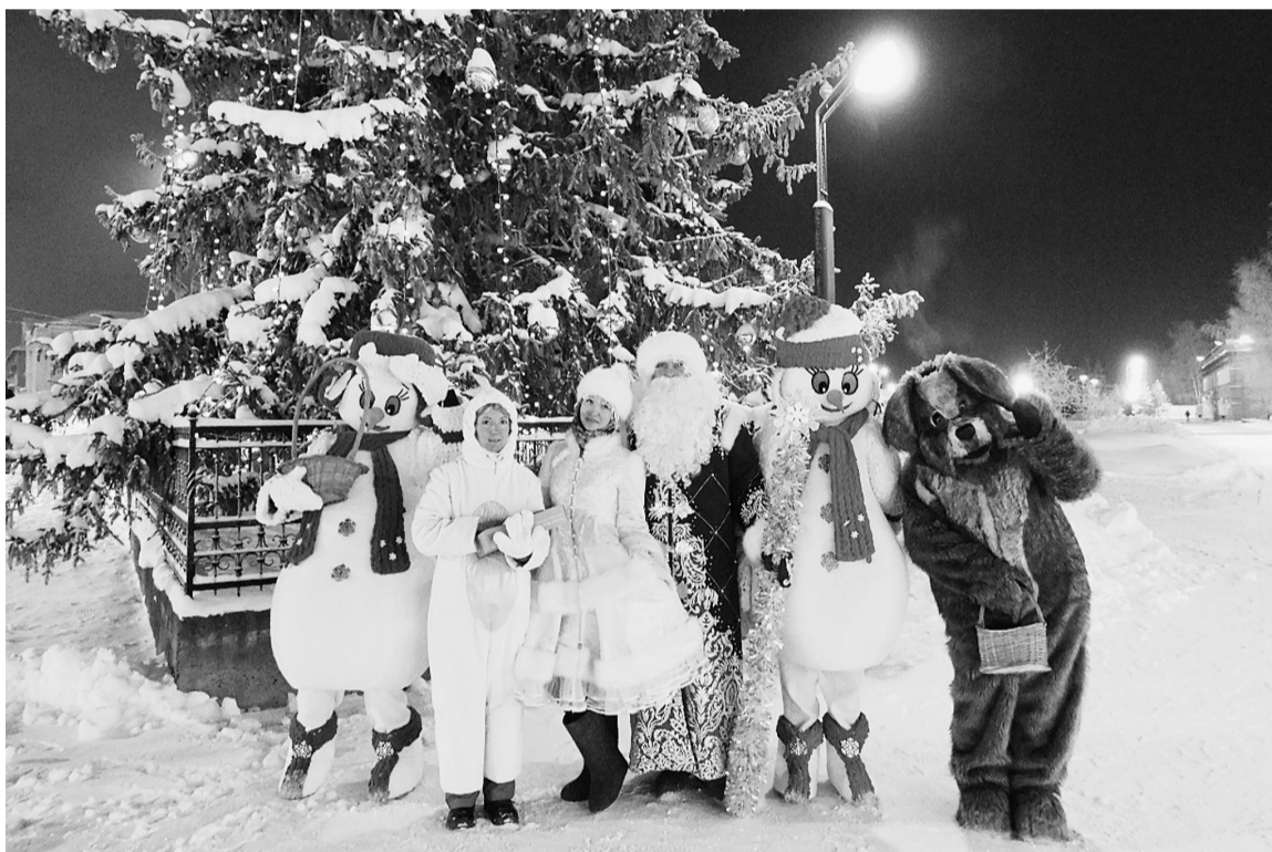
И снова с Новым годом АО «Соликамскбумпром»! Счастья в новом году!

На фоне тёмного ещё утреннего неба сверкали шустрые огоньки гирлянды нашей красавицы ёлки. Проверим, насколько вы внимательны, коллеги?