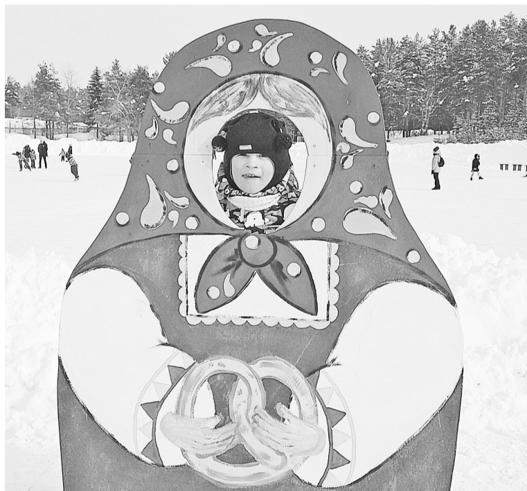
Конфетки, бараночки...

ДК «Бумажник» подвёл итоги фотоконкурса «Зимние фантазии». По обязательному условию конкурса фотографии должны быть сделаны на территории АО «Соликамскбумпром» и его социальных объектах.