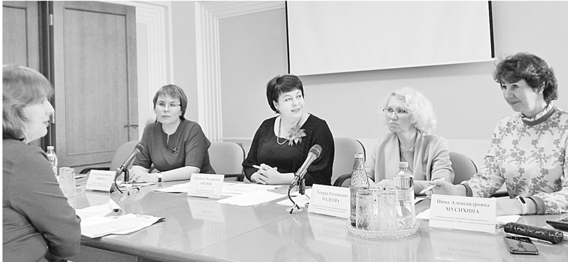
Отборочный тур конкурса социально-культурных проектов

АО «Соликамскбумпром» продолжает свою активную благотворительную деятельность. В этом году предприятие вновь объявило общественный конкурс социально-культурных проектов, целью которого является поддержка инициативы жителей Соликамского городского округа в решении актуальных социальных проблем.