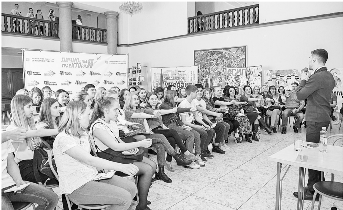
Умение владеть словом сегодня востребовано. Площадка «Ораторское мастерство»

Эта строчка из популярной песни Ёлки стала настоящим девизом молодёжного форума Верхнекамья «ЛичноСтная траекТОрия». Значимое для самых активных и перспективных мероприятие состоялось 6 апреля в ДК «Бумажник» при поддержке АО «Соликамскбумпром».