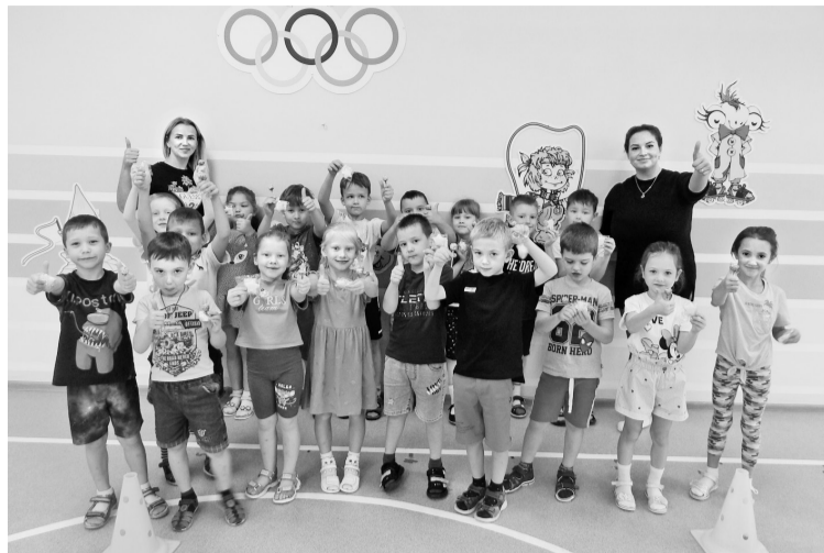
«Бумеранг» в гостях в детском саду № 25

Одиноким бабушке привезли дрова и их некому перетаскать в дровяник? — Пожалуйста! Встать рано утром, чтобы раздать праздничный выпуск газеты? — Согласны! Провести познавательный досуг с детьми? — Опять за!