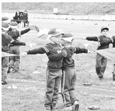
Яркое выступление спортсменов из д/с № 25

мальчиков. — Я старался ехать быстро, боялся, что меня обгонят!