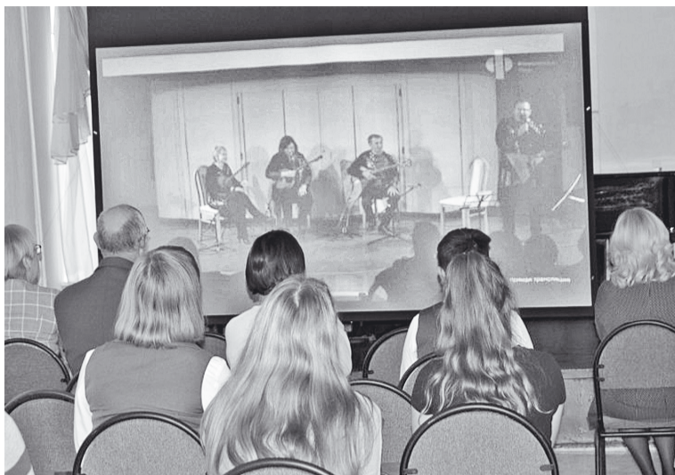
Первый концерт в виртуальном зале

У нас появилась возможность осуществлять прямые трансляции из зала Московской консерватории, органного зала Пермской краевой филармонии. Ресурс виртуального концертного зала позволит организовать современный образовательный процесс, создать условия для творческого роста обучающихся и преподавателей не только нашей школы, но и общеобразовательных школ, детской музыкальной школы № 2, а также укрепить партнёрские связи с учреждениями образования, культуры, общественными организациями. И самое важное — приоб-