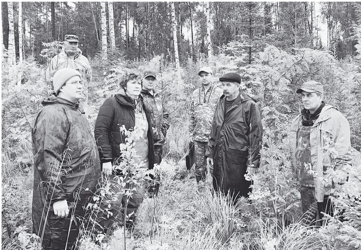
Участники выездного совещания проводят обследование вырубок