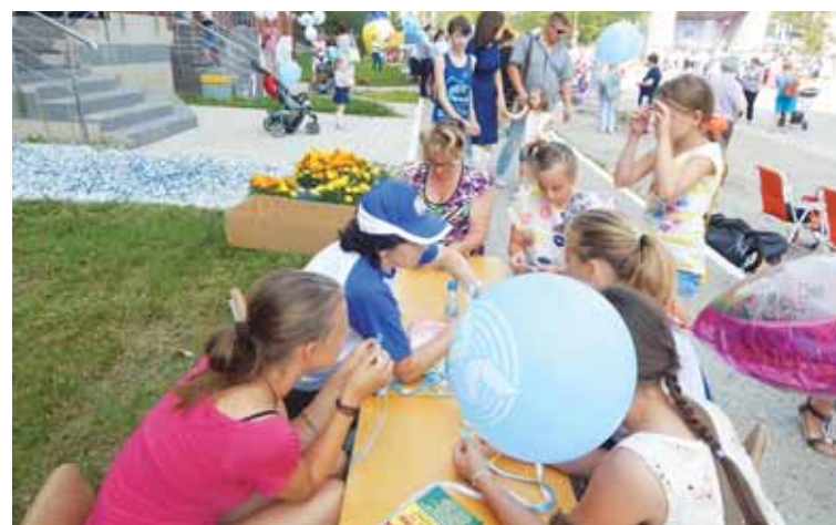
Мастер-классы пользовались спросом у креативных юных соликамцев.