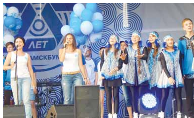
Музыкальное поздравление от молодого поколения бумажников и артистов «Перемень».