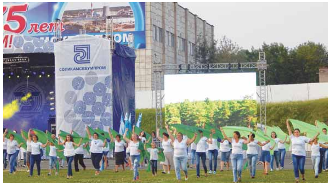
Участвовали с воодушевлением.