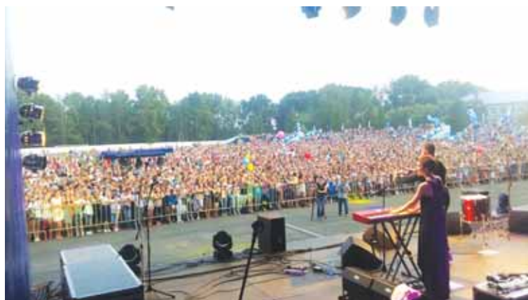
Группа «Пицца» и её поклонники.