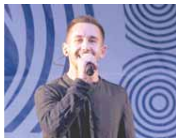
Группа Пицца поёт для соликамцев.