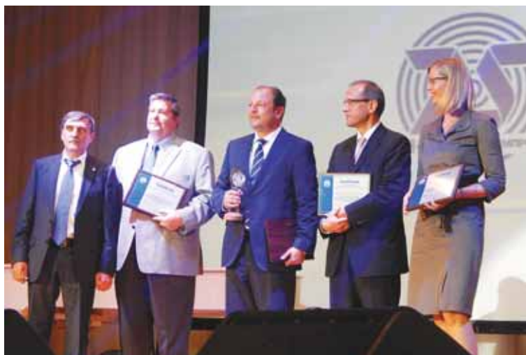
Дипломанты в номинации «Техническое обновление производства».