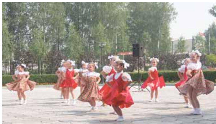
Мальчи НДОУ «ЦРР «Соликамскбумпром» танцем рассказали гостям о русском самоваре.