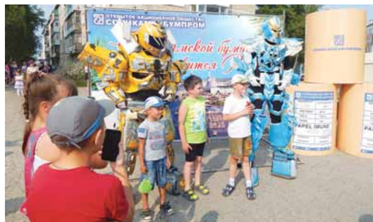
Юное поколение выбирает роботов и АО «Соликамскбумпром».