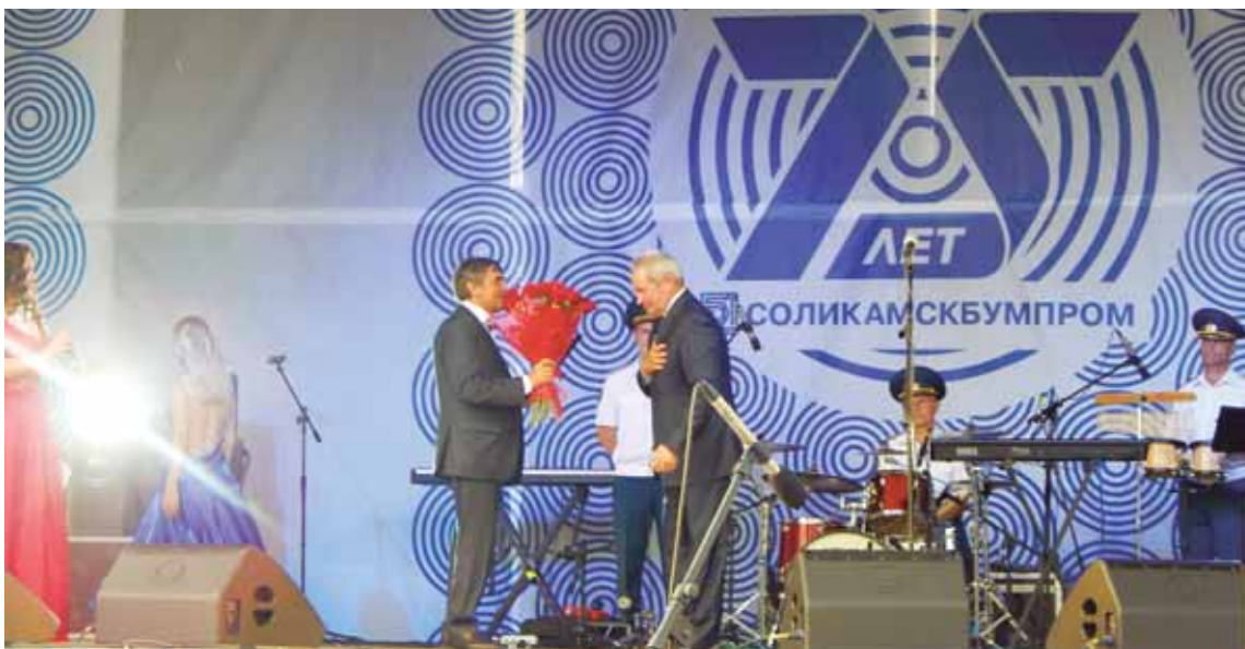
Губернатор Пермского края В.Ф. Басаргин поздравляет в лице В.И. Баранова коллектив АО «Соликамскбумпром» с юбилеем!

ПРОЙДЯ СЛОЖНЫЙ ПУТЬ СТАНОВЛЕНИЯ И РАЗВИТИЯ ДЛИНОЮ В 75 ЛЕТ, АО «СОЛИКАМСКБУМПРОМ» ОСТАЁТСЯ КРУПНЕЙШИМ ПРЕДПРИЯТИЕМ ЦЕЛЛЮЛОЗНО-БУМАЖНОЙ ПРОМЫШЛЕННОСТИ РОССИИ И УСПЕШНО ПРОДОЛЖАЕТ РАБОТАТЬ НА БЛАГО ГОРОДА, КРАЯ, СТРАНЫ. ОДИМ ИЗ ВАЖНЫХ СЛАГАЕМЫХ ЕГО УСПЕХА ЯВЛЯЕТСЯ МНОГОЛЕТНЕЕ ПЛОДОТВОРНОЕ СОТРУДНИЧЕСТВО С ПАРТНЁРАМИ ИЗ РОССИИ, БЛИЖНЕГО И ДАЛЬНЕГО ЗАРУБЕЖЬЯ.