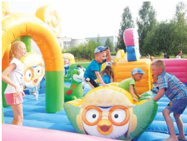
Лето, дети и их любимые батуты.