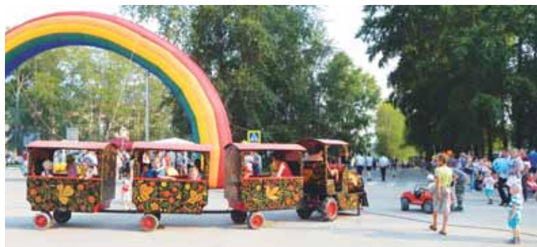
На таком поезде можно было объехать все праздничные площадки.