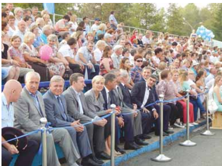
На трибуне высокие гости.