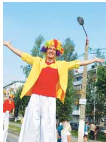
Ходулисты старались поднять всем настроение как можно выше.