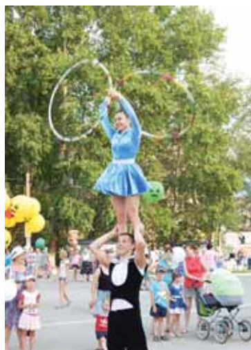
Музыканты, плясуны, жонглёры...