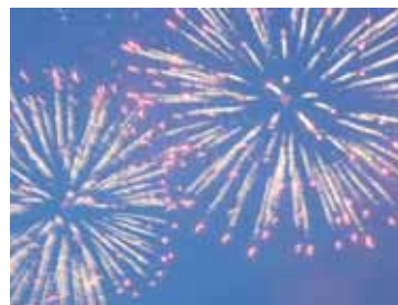
Ночное небо расцветил фейерверк.