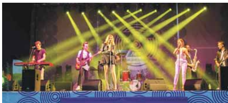
Под песни «Новых самоцветов» танцевал весь стадион.