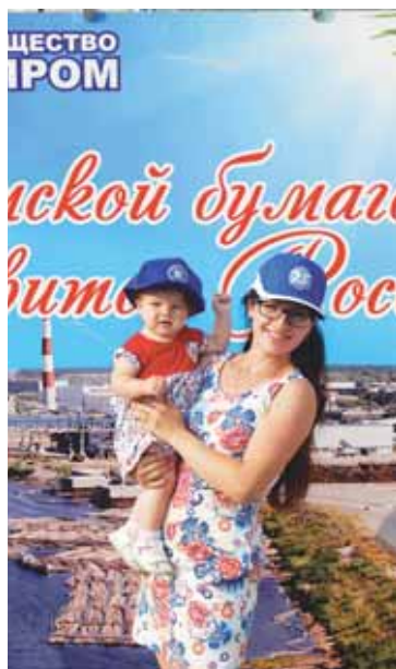
Мы в бумажники пойдём.