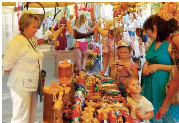
Многие купили на память о празднике сувениры.