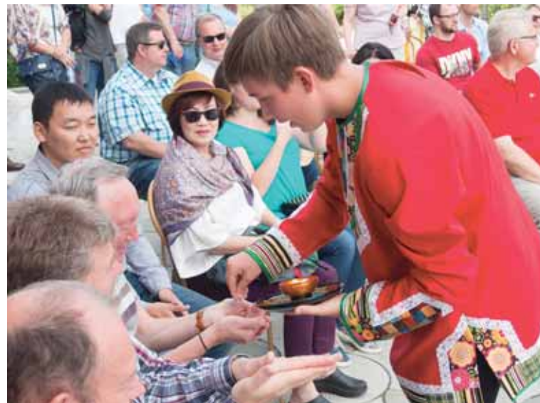
Щепотка соли в ладонь — на удачу.

из партнёров, приглашая их на сцену. Со многими компаниями, предприятиями, фирмами АО «Соликамскбумпром» поддерживает отношения несколько десятков лет. Разные направления сотрудничества — разные номинации: «Техническое обновление производства», «Финансы и Кредит», «Крупнейший зарубежный покупатель газетной бумаги АО «Соликамскбумпром», «Крупнейший потребитель газетной бумаги АО «Соликамскбумпром» в России», «Материально-техническое обеспечение производства», «Транспорт и логистика».