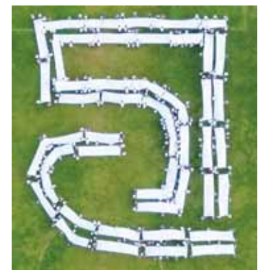
Фотография, сделанная дроном.