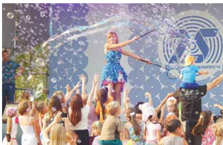
И дети, и взрослые в восторге от шоу мыльных пузырей.