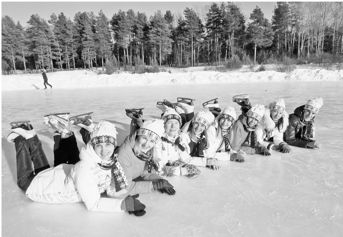
Быть спортивным — это модно! Фотография, представленная администрацией ЧДОУ ЦРР «Соликамскбумпром» на фотоконкурс «Зимние объятия» КСЦ ДК «Бумажник» в номинации «Зимние забавы»

Лыжи в прокат берут реже, в основном приходят со своими, поэтому количество лыжников подсчитать сложно. В этом году