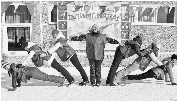
Фото-победитель в номинации «Мы — спортивные»