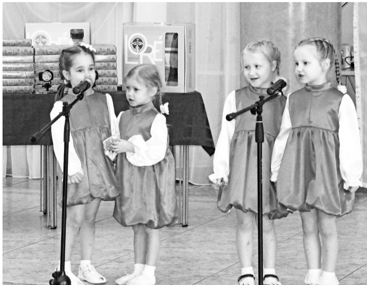
Выступление вокальной студии «Мелодия»

Хотя это были объятия зимы. Весело было кататься на коньках и «ватрушках», праздновать Новый год и Масленицу... Снежок украшал и свадебные торжества.