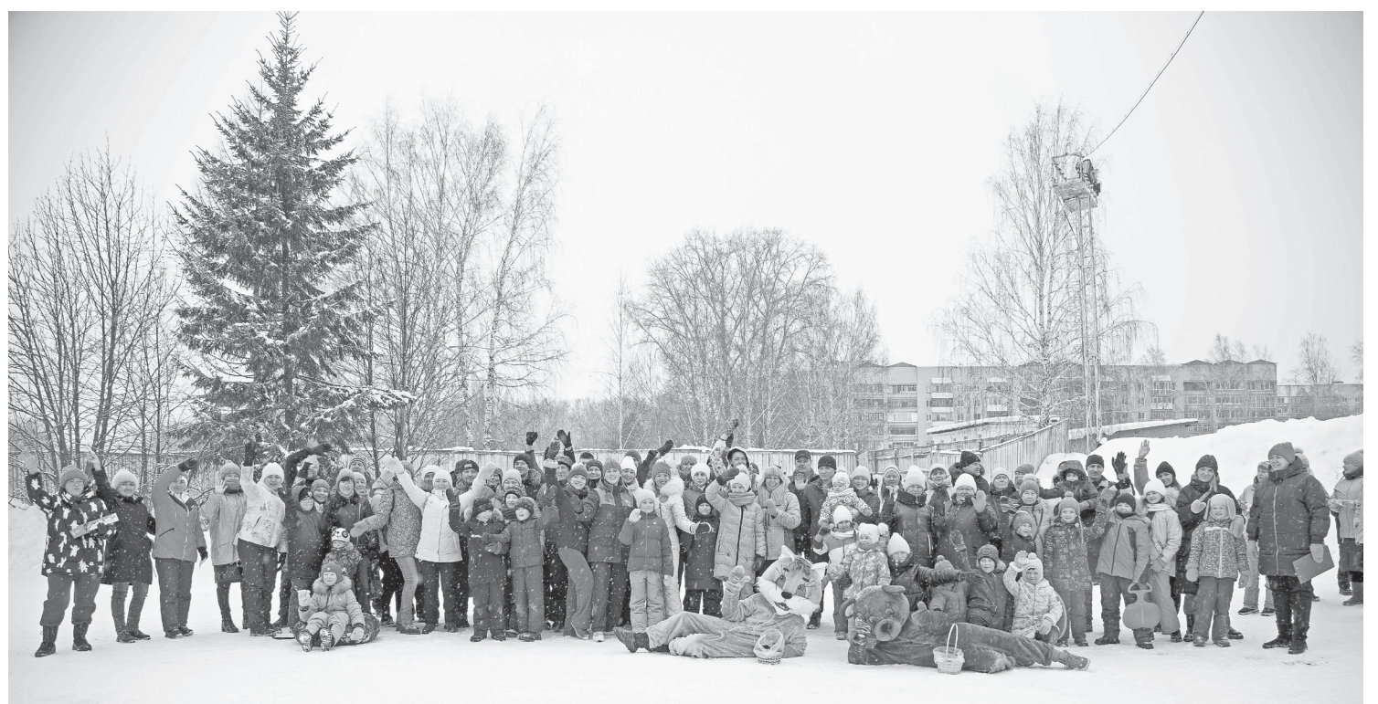
«Зимние забавы - 2023»: фото на память

— С марта 2023 года стартовал марафон производственной гимнастики под названием «Минуты активности». В этом году нам удалось выявить амбассадоров здоровья, которые собственным примером вдохновляют и поднимают свой трудовой коллектив