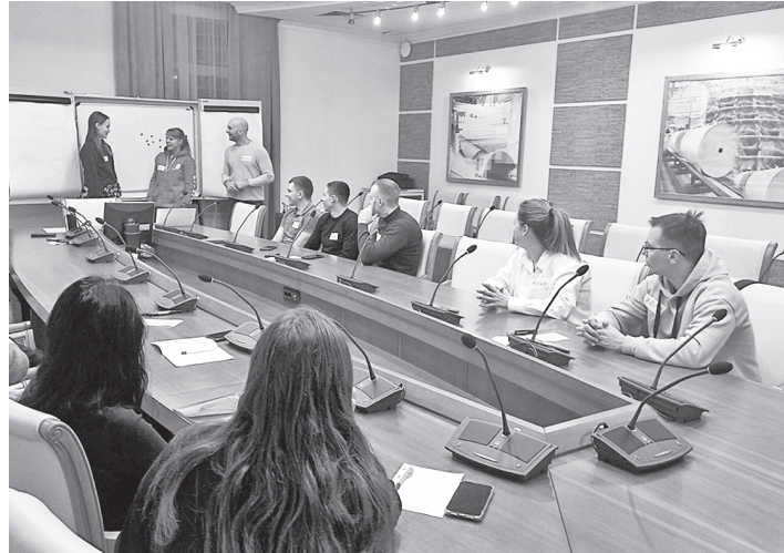
Тренировка навыков коммуникации

Молодые работники АО «Соликамскбумпром» стали участниками очередной рабочей сессии «Стратегия развития молодёжного объединения на предприятии», которая состоялась 6 декабря в ДК «Бумажник».