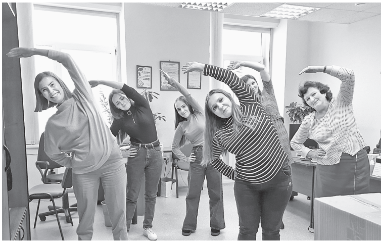
Ежедневная производственная гимнастика в ОУДи Д