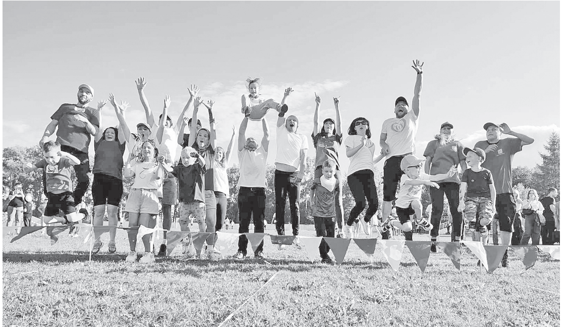
Спортивный БУМ для всех — мальчишек и девчонок, а также их родителей