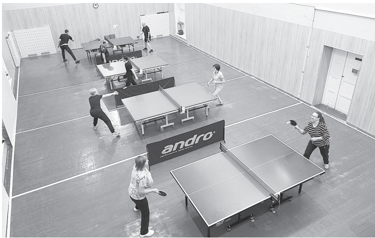
В соревнованиях по настольному теннису может принять участие любой бумажник