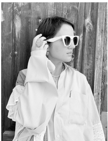
В своей авторской одежде

В этом году начала шить чепчики. Идею подсмотрела на показах модных дизайнеров. Модный головной убор называют чепчиком, хотя он больше похож на непристёгнутый капюшон. Я сшила несколько своих разных моделей.