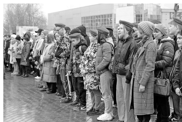
Юные участники митинга