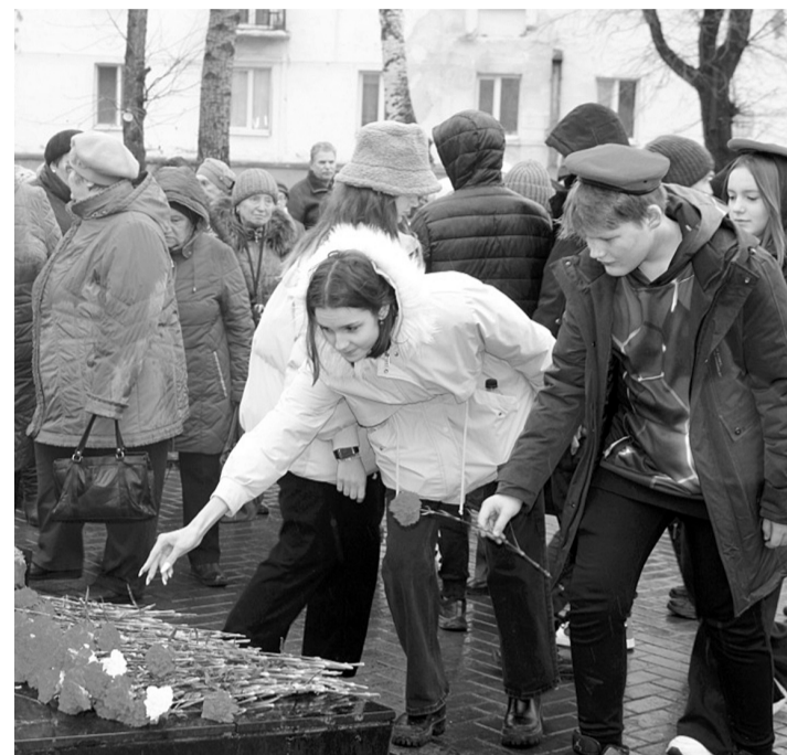
Возложение цветов к памятнику

Ежегодно 30 октября в России отмечается День памяти жертв политических репрессий. Это напоминание о трагических страницах в истории страны, когда тысячи людей были необоснованно обвинены в преступлениях, отправлены в лагерь, лишены жизни.