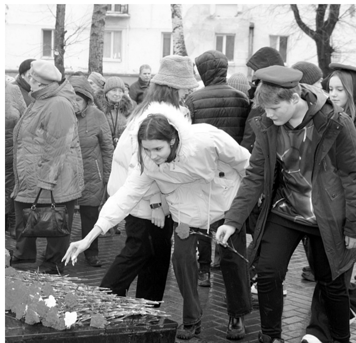
Возложение цветов к памятнику

Ежегодно 30 октября в России отмечается День памяти жертв политических репрессий. Это напоминание о трагических страницах в истории страны, когда тысячи людей были необоснованно обвинены в преступлениях, отправлены в лагерь, лишены жизни.