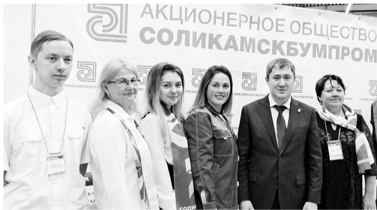
Дружный коллектив специалистов АО «Соликамскбумпром» с губернатором Пермского края на выставке

Кем быть, когда вырасту? Где я хочу работать и где могу для этого получить образование? Над этим в своё время задумывался каждый из нас. Современным подросткам в 15 лет тоже довольно трудно определиться с ответом.