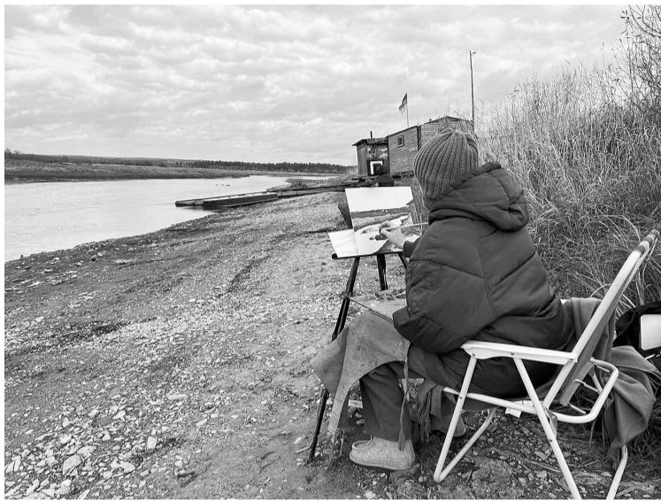
Заниматься живописью на природе — двойное удовольствие