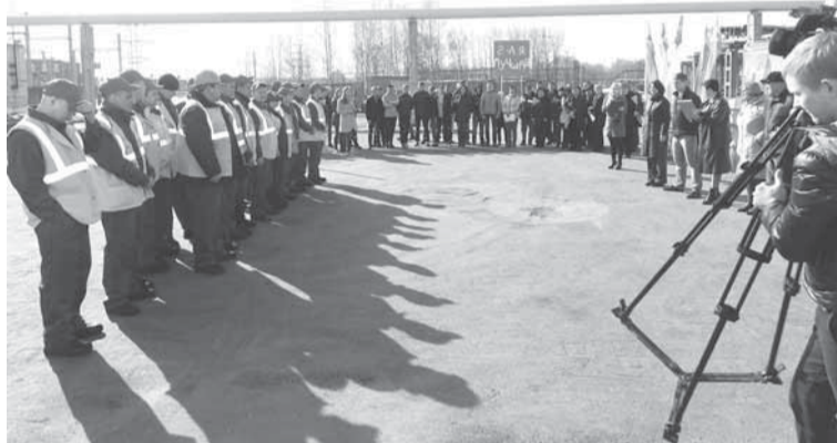
Конкурсанты, болельщики, администрация и телевидение к старту конкурса готовы.