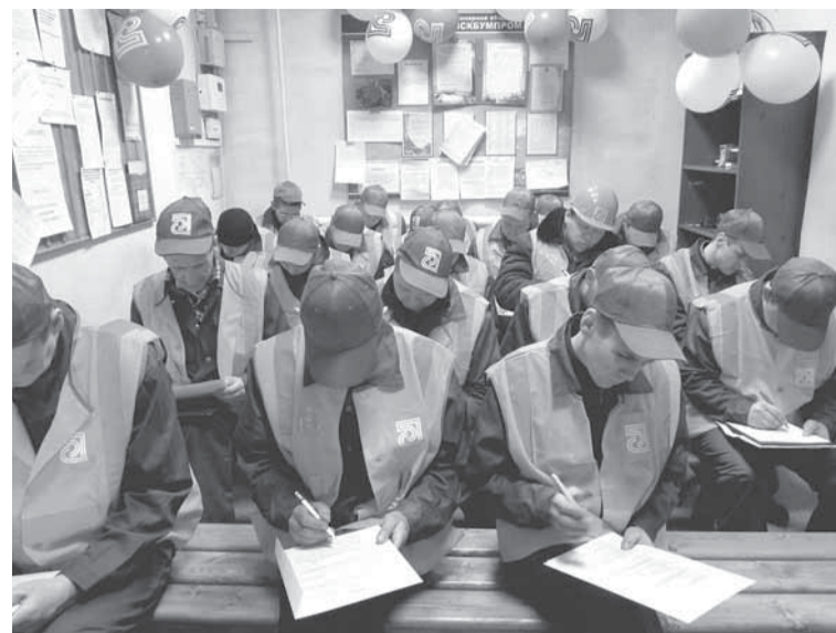
С теоретическими вопросами разобрались спокойно и быстро.

Водитель дизельного погрузчика — последний кто соприкасается с рулонами — на нем лежит высокая ответственность и от его