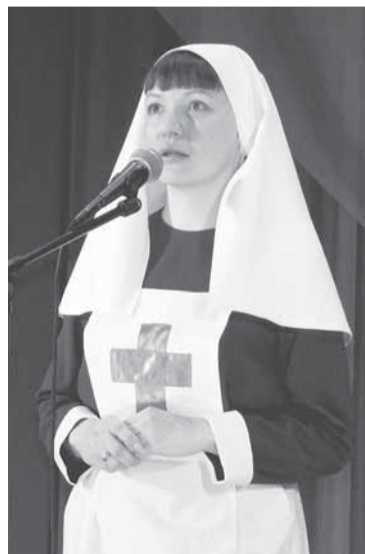
Нефронтovým городам посвящается...