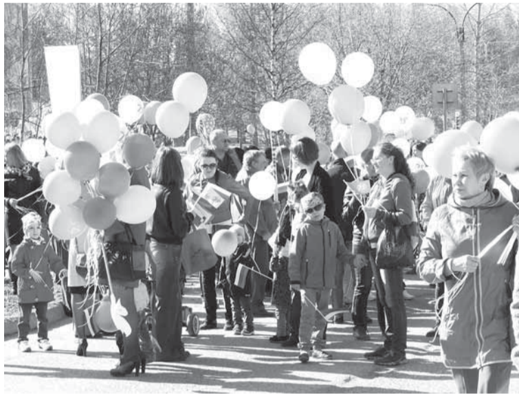
Бумажники собираются в праздничную колонну.

Во главе колонны также всегда следует празднично украшенный автомобиль. В этом году специалисты отдела по связям с общественностью разработали новый дизайн, в ярких сочных цветах и с юбилейной символикой. О 75-летнем юбилее предприятия напоминают и воздушные шары. Непременно развеваются на ветру