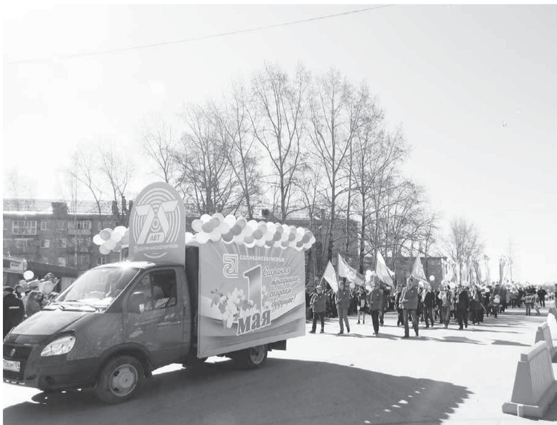
Наш выход на Первомайскую площадь.

ПЕРВОМАЙ НЕ ПЕРВОМАЙ БЕЗ ДЕМОНСТРАЦИИ. ТРУДОВЫЕ КОЛЛЕКТИВЫ СОБИРАЮТСЯ В КОЛОННЫ, КОТОРЫЕ ДАЮТ ОЩУЩЕНИЕ НАДЁЖНОГО ДРУЖЕСКОГО ПЛЕЧА РЯДОМ. НИ С ЧЕМ НЕСРАВНИМОЕ ЧУВСТВО ЕДИНЕНИЯ!