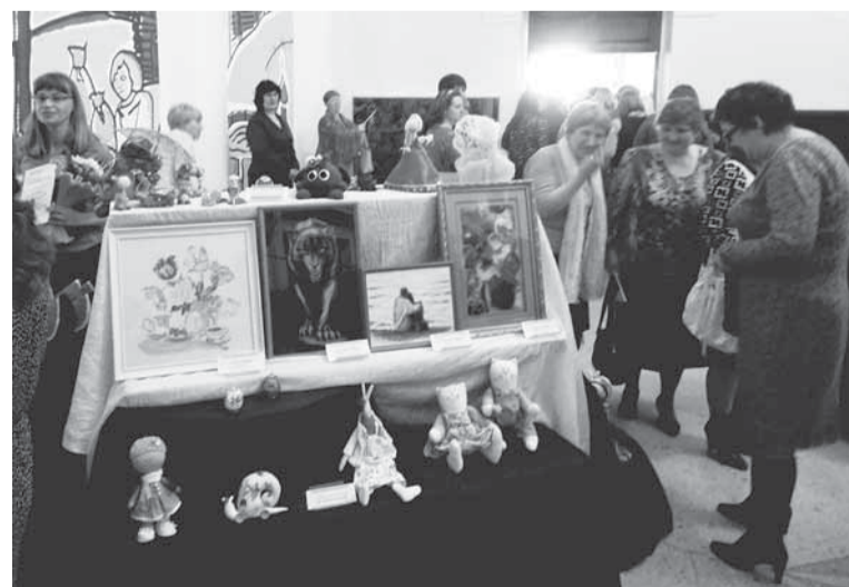
Выставка творческих работ в фойе Дворца культуры.