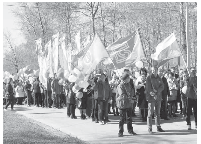
Гордо реют наши знамена.

Даже не в лучшую погоду они приходят на демонстрацию с мамами и папами, бабушками и дедушками. А в этом