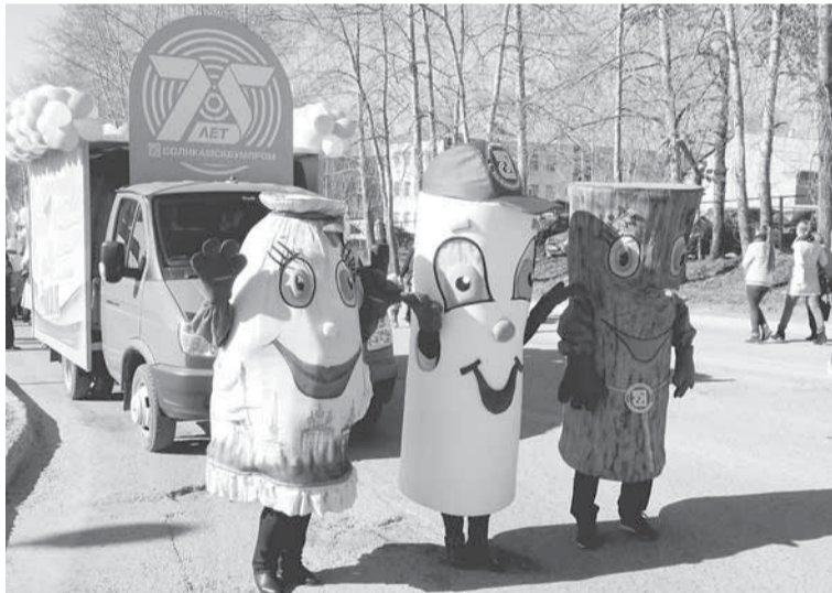
По традиции во главе колонны Солик, Бумик и Балансик.

В начале колонны всегда в бодром расположении духа гордо идут наши ветераны.