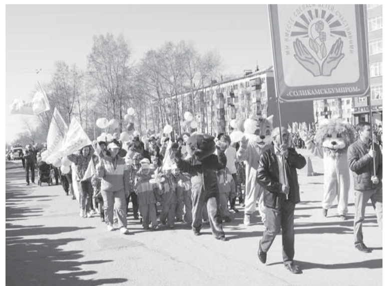
На праздничную площадь вступает счастливое детство.

Традиционно за бумажниками следуют колонны НДОУ «ЦРР «Соликамскбумпром» и дочернего предприятия