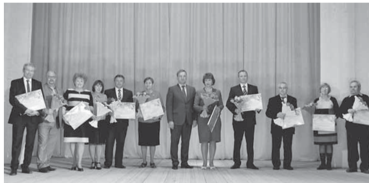
Награждённые Дипломами общественного признания.