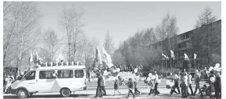
Перед трибунами проходит колонна дочернего предприятия — «Соликамской ТЭЦ».

ООО «Соликамская ТЭЦ». Они отличаются яркой узнаваемой символикой. По моему мнению, в этом году работни-