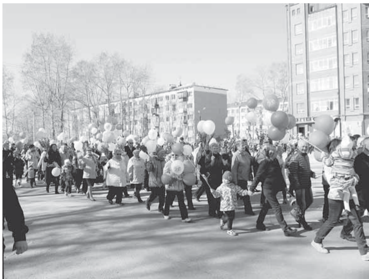
Колонна бумажников проходит по праздничной площади.

Праздничная колонна бумажников отличается также большим количеством детей самых разных возрастов.