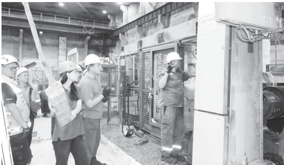
Идут работы на продольно-резательном станке № 2.

ПРЕДПРИЯТИЕ ЗАДОЛГО НАЧИНАЕТ ГОТОВИТЬСЯ К ВАЖНОМУ СОБЫТИЮ — ПРОВЕДЕНИЮ ОБЩЕГО ПЛАНОВОГО ОСТАНОВА НА КАПИТАЛЬНЫЙ РЕМОНТ. ЕЖЕГОДНО ТАКОЙ РЕМОНТ ПРОВОДИТСЯ С ЦЕЛЮ ОБЕСПЕЧИТЬ НА ДЛИТЕЛЬНЫЙ СРОК РАБОТОСПОСОБНОСТЬ ОСНОВНОГО ТЕХНОЛОГИЧЕСКОГО ОБОРУДОВАНИЯ И ВОССТАНОВЛЕНИЕ ЕГО РЕСУРСА.