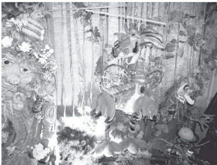
Обитатели лесного царства.

Любой взрослый превращается в ребёнка в залах Лесного царства. Сказочные, фантастические и забавные существа: Леший, Кикимора, Дракодил, Кракодрак погружают в атмосферу таинственности и волшебства.