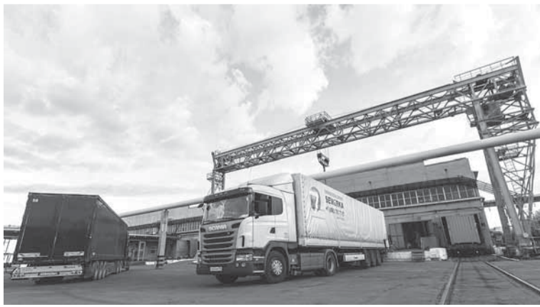
Газетная бумага ОАО «Соликамскбумпром» отправляется потребителям автомобильным, железнодорожным и водным транспортом.