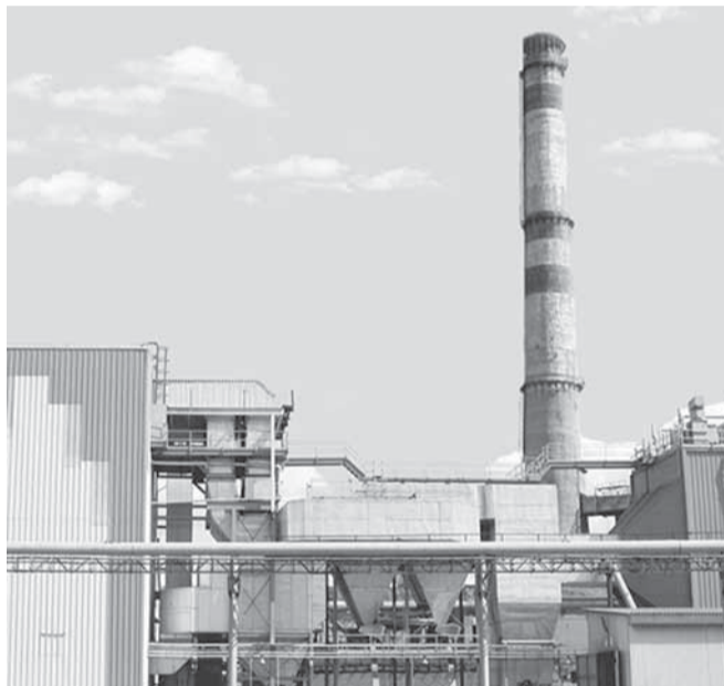
Производство тепловой энергии на установке по сжиганию отходов в 2015 году увеличилось.

Для сохранения конкурентоспособности основной продукции предприятия — газетной бумаги — необхо-