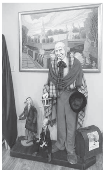
Приглашаем в мир кукол!

Музей занимает небольшой особняк. В 9 залах можно увидеть коллекции самых разных кукол. Здесь собраны русские фольклорные куклы, антикварные, интерьерные, сувенирные, авторские... Часть экспозиции музея составляют текстильные коллажи, маски, выполненные студентами постановочного факультета Академии театрального искусства.