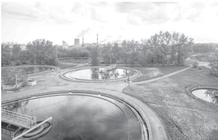
Природоохранную деятельность предприятие ведёт в разных направлениях.

Общество продолжает содержать ряд объектов социальной сферы и использует их по прямому назначению. Поликлиника, цех спортивных