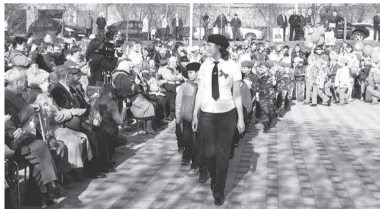
Равнение на ветеранов!

тят быть «иванами родства не помнящими». Поэтому они с новыми чувствами приходят на традиционные митинги и парады в честь победы в Великой Отечественной войне.