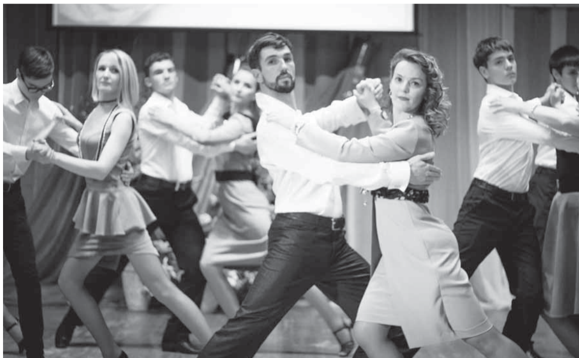
Сотрудники НДОУ «ЦРР «Соликамскбумпром» удивляли в этот вечер зрителей своими многогранными талантами. А танго в исполнении административной группы сорвало бурю оваций.

ПОД ТАКИМ НАЗВАНИЕМ ПРОШЛО В МИНУВШУЮ СУББОТУ В ДК «БУМАЖНИК» ТОРЖЕСТВЕННОЕ МЕРОПРИЯТИЕ, ПРИУРОЧЕННОЕ КО ДНЮ ДОШКОЛЬНОГО РАБОТНИКА И ПОСВЯЩЁННОЕ 10-ЛЕТНЕМУ ЮБИЛЕЮ НДОУ «ЦРР «СОЛИКАМСКБУМПРОМ».