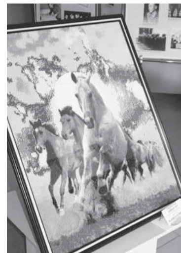
Алмазная вышивка «Скорость и изящество».

Работы выполнены в самых разных техниках. Вышивка — крестиком, гладью, лентами, бисером, алмазная, ковровая. Куклы вязаные, выполненные в скульптурно-чулочной технике, тильды, народные, куклы-шкатулки. Привлекают внимание сухое