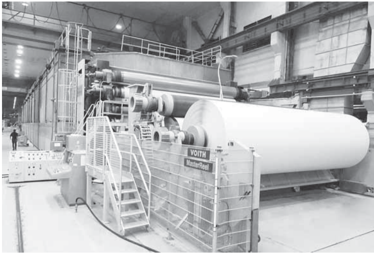
Новой модернизации БДМ № 1 ждать недолго.

— 14 специалистов фирмы, отвечающих за проектирование, приезжали к нам на предприятие. Были произведены необходимые замеры на БДМ № 1, собрана необходимая техническая документация, чертежи существующих конструкций буммашины. Состоялось совещание, на котором фирма Voith предоставила на согласование предлагаемые новые конструкции. Был составлен протокол, согласно которому началась работа по проектированию узлов, частей, ведутся расчёты технологических параметров. Мы предоставляем необходимую проектантам дополнительную информацию, документацию. С фирмой тесно работают специалисты второго бумажного производства, проектно-конструкторского отдела, отдела