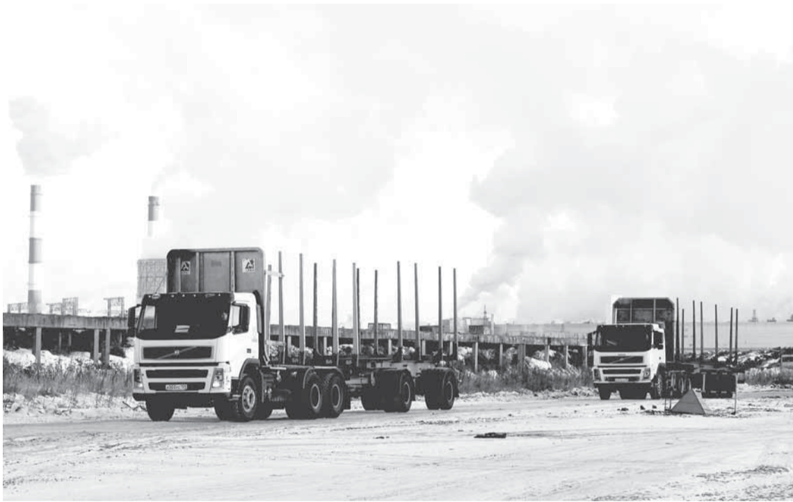
Парад автолесовозной техники 2014 года.

ДЛЯ ВОДИТЕЛЕЙ АВТОЛЕСОВОЗНОГО ЦЕХА НАЧИНАЕТСЯ ГОРЯЧИЙ СЕЗОН. СИМВОЛИЧНО, ЧТО КАЖДЫЙ ГОД ЭТО ПРОИСХОДИТ В КАНУН ИХ ПРОФЕССИОНАЛЬНОГО ПРАЗДНИКА — ДНЯ АВТОМОБИЛИСТА.