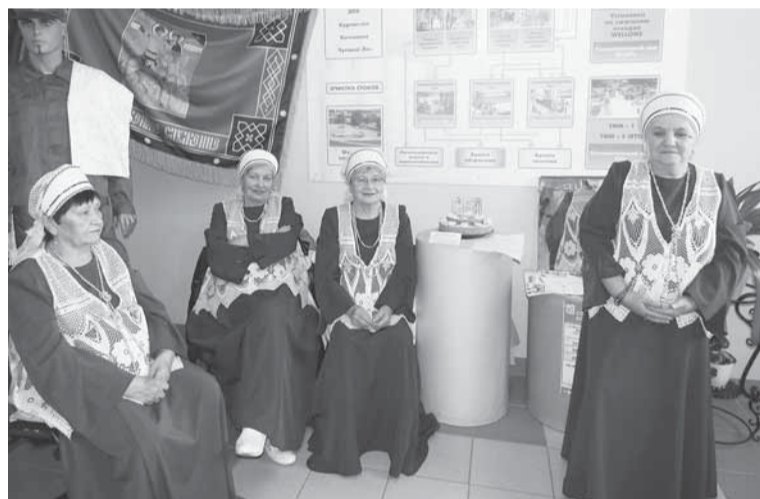
Хор «Лейся, песня!» готовится выступить перед гостями из Половодова.

ярким событием для ветеранов ОООАО «Транспорт», завода «Урал», села Половодо. Здесь их ожидал также приятный сюрприз — песни в исполнении хора ветера-