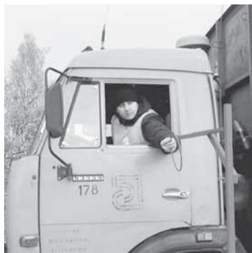
Главное — точность.

Быстрее — потому что водители состязаются на скорость. Точнее — потому что количество ошибок влияет на результат. Выше — потому что одно из заданий в номинации «Лучший водитель автомобиля, оборудованного гидроманипулятором» называется «Пирамида». Мы все в детстве строили пирамидки из кубиков. А вот водителям предстоит сделать то же самое с помощью гидроманипулятора из трёх небольших чурбачков. И максимальное количество баллов поставят лишь в том случае, если пирамида не упадёт. С «кубиками», а точнее, с десятью кубами древесины связано и первое задание — води-