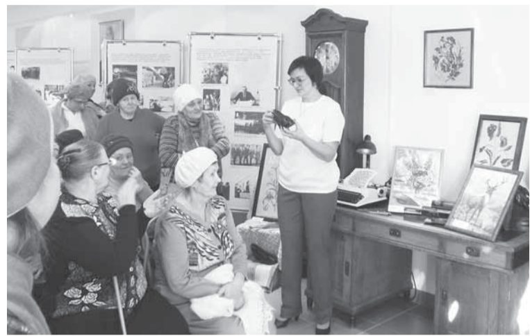
Ветеранам из Половодова тоже есть, что рассказать о некоторых экспонатах нашего музея.

Эти слова поэта Андрея Дементьева в полной мере можно отнести к музею истории АО «Соликамскбумпром».