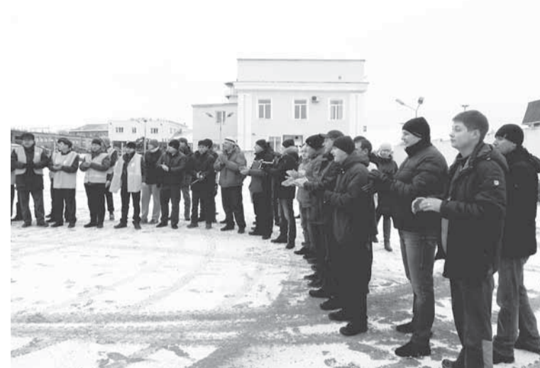
К старту готовы!

Закончилось время ожидания для конкурсантов третьей номинации — «Лучший водитель грузового автомобиля». Как и следовало ожидать, большинство участников — водители АЛЦ.