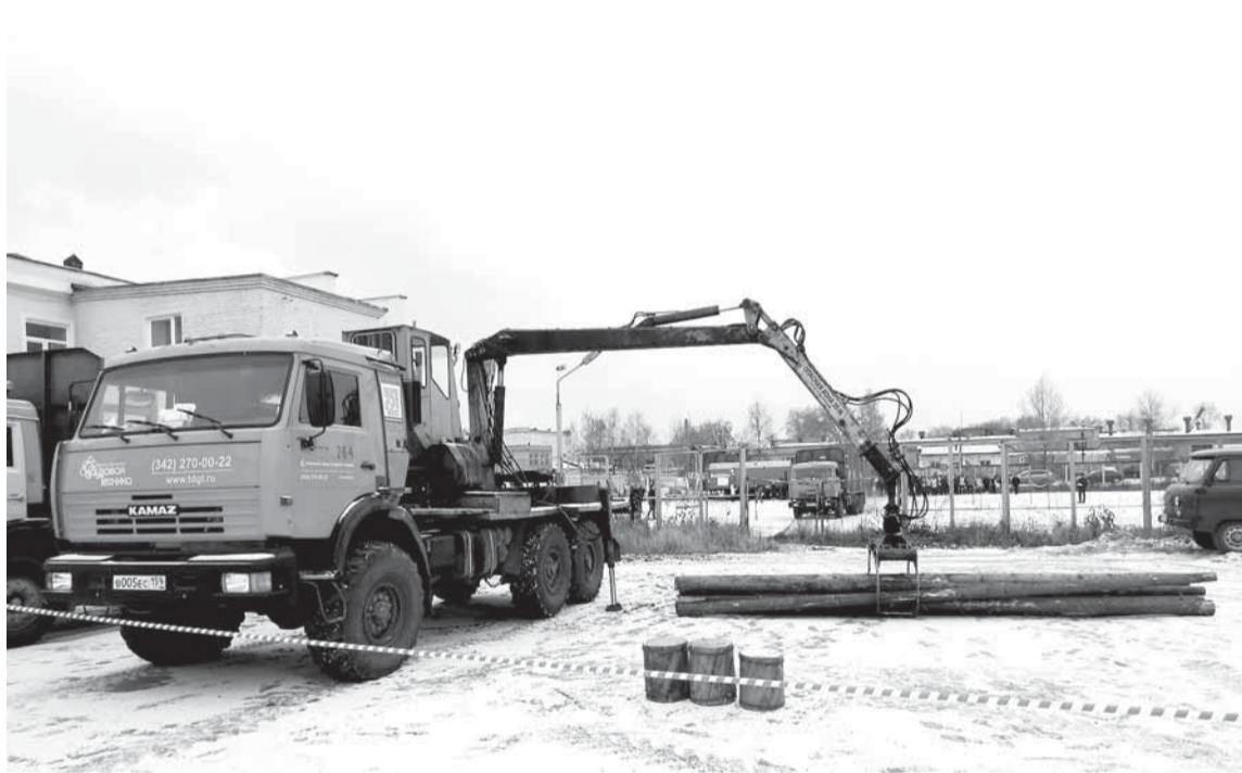
Самая зрелищная номинация — «Лучший водитель автомобиля, оборудованного гидроманипулятором».