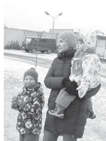
«Мы верим — папа победит!»