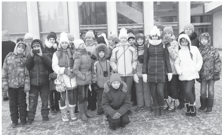
Вот такой большой компанией мы гуляли по Москве.

— Трёхдневная программа пребывания в Москве была очень насыщена. Дети посетили Кремль, киностудию «Мосфильм», Московский зоопарк, цирк на Цветном Бульваре, самый большой океанариум в Европе «Москвариум». Увидели нарядные, шикарные столичные ёлки. Красавица Москва встретила нас морозом. Но мы не испугались и стойко перенесли все трудности. Дети в восторге!