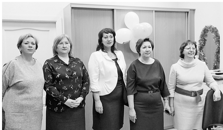
Строгая конкурсная комиссия