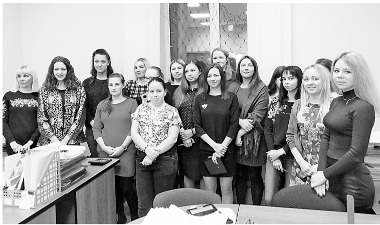
Участники перед стартом конкурса

Участников конкурса оценивало компетентное жюри, в составе которого были руководители