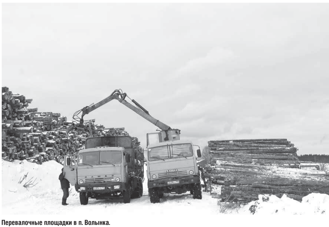
Перевалочные площадки в п. Волынка.

САМАЯ ГОРЯЧАЯ ПОРА ДЛЯ ВЫВОЗКИ ДРЕВЕСИНЫ ПРИХОДИТСЯ НА ЗИМНИЙ ПЕРИОД. ПОКА ДОРОГИ НЕ ПАЛИ, РАБОТНИКИ АЛЦ ТРУДЯТСЯ В ПОЛНУЮ СИЛУ. СУЩЕСТВЕННАЯ ПОМОЩЬ ЧУВСТВУЕТСЯ И ОТ ПЕРСОНАЛА ОСП «ВИШЕРА». КАК ПРОХОДЯТ ТРУДОВЫЕ БУДНИ, И КАКОВЫ УСЛОВИЯ ТРУДА НАШИХ КОЛЛЕГ НА СЕВЕРЕ КРАЯ, ВООЧИЮ УВИДЕЛА КОРРЕСПОНДЕНТ ГАЗЕТЫ «КРАСНАЯ ВИШЕРА».