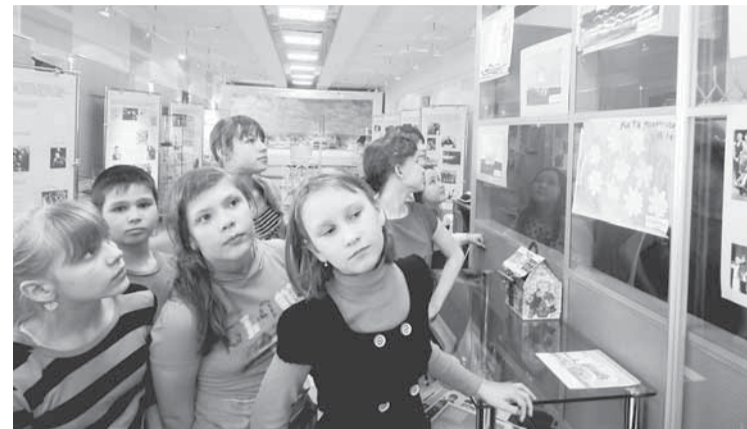
Учащиеся школы №10 знакомятся с творческими работами детей общественной организации «Луч».

Жизнь в музее истории нашего предприятия наполнена красками: проходят экскурсии, юбилейные встречи работников подразделений с ветеранами, организуются различные выставки.