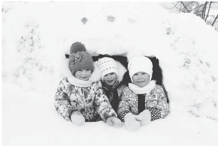
Вместе в норке интересней.

В детском саду № 22 родилась идея: «Почему не создать сказочный мир своими руками?» Ведь снега этой зимой предостаточно! А главное, сколько веселья и радости будет у детей!