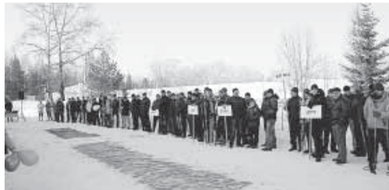
К победам готовы.

И ожидания бумажников не были обмануты! Спортивные соревнования «Зимние забавы» стало настоящим праздником.