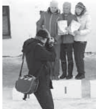
Победительницы лыжной гонки.