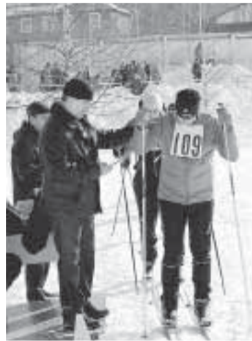
Внимание! Стартует директор.

Проигравших в этот день точно не было. У всех без исключения было радостное настроение. Организаторы