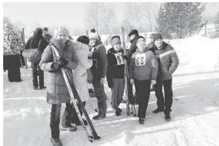
У команды ОЛТК настрой боевой.

Участников было столько, что регистрация заняла время. Зарегистрировавшиеся вовсю разминались, настраивались на старт. Выделялись участники и их группы поддержки из древесномассного производства, отдела лабораторного и технического контроля, отдела стандартизации. У некоторых участников была очень серьезная экипировка, чувствовалось, что занимаются лыжным спортом всерьез. Еще отметила для себя, что среди спортсменов-лыжников немало наших ветеранов.