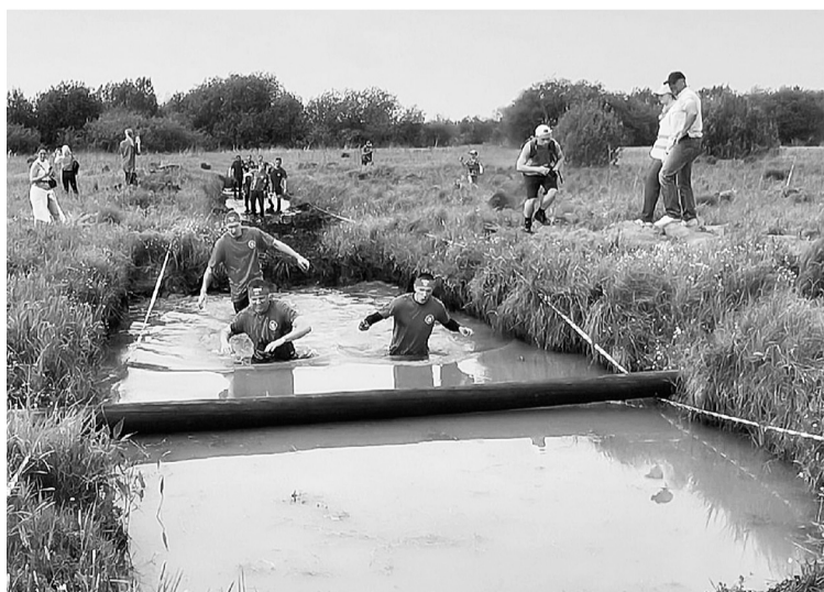
Дружина бумажников штурмуют водную преграду