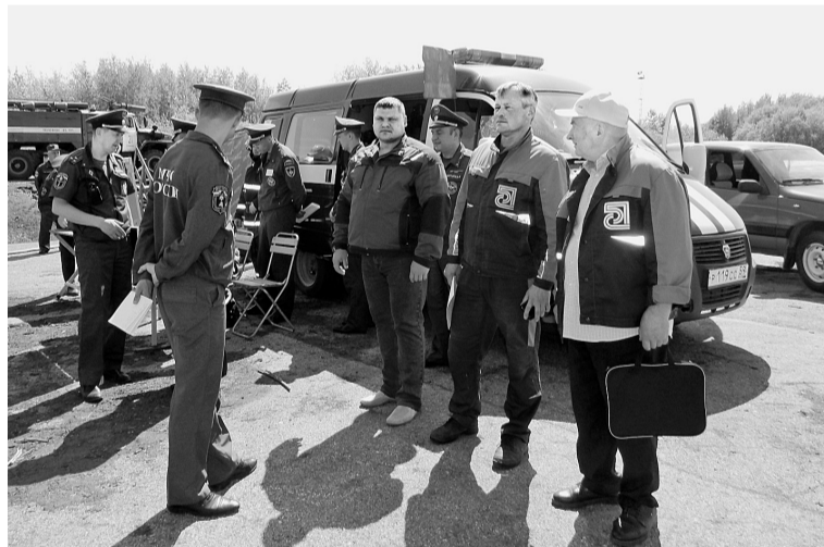
Со штабом спасателей взаимодействовала комиссия АО «Соликамскбумпром» по чрезвычайным ситуациям