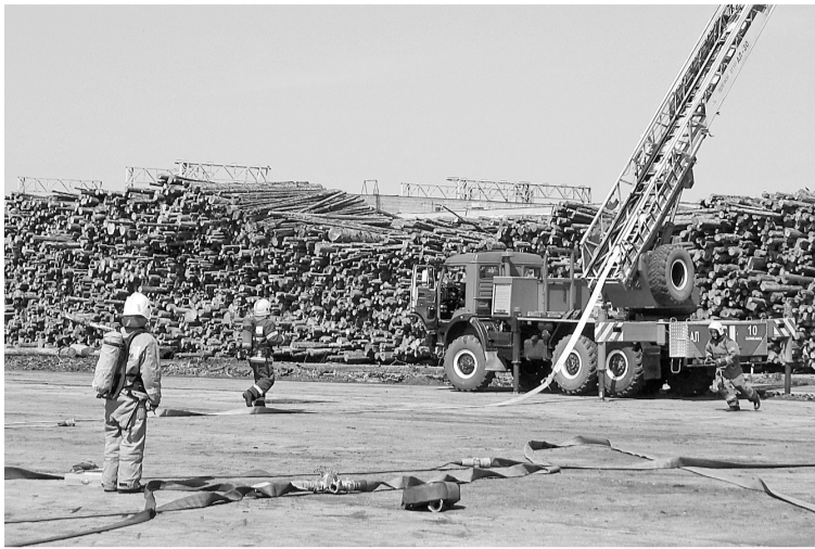
Пожарные-спасатели действовали профессионально и оперативно

На лесосырьевом производстве было жарко не только из-за погоды. Сюда съехались пожарно-спасательные отряды со всего Соликамска и соседних городов края. Сотрудники МЧС в бойцовках быстро развернули противопожарную технику и приступили к тушению пожара.