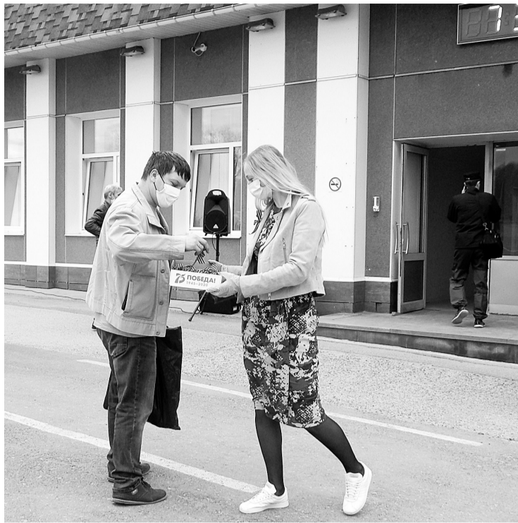
У центральной вахты предприятия прошла акция «Георгиевская лента»