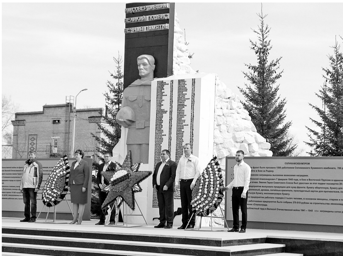
Торжественная церемония возложения венков у Памятника павшим воинам бумажникам

Бумажники ежегодно поддерживают славные традиции празднования Дня Победы. Ранним утром, 8 мая этого года у центральной вахты предприятия прошла акция «Георгиевская лента». Праздничная военная музыка встречала работников комбината, каждому из которых организаторы акции вручали георгиевскую ленту — главный символ Победы. Оранжево-чёрная ленточка не даёт забыть новым поколениям, кто и какой ценой одержал победу, чьими наследниками мы остаёмся, кем должны гордиться, о ком помнить.