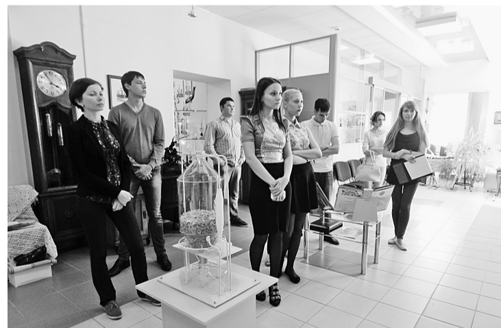
Молодые специалисты и рабочие знакомятся в музее с историей предприятия