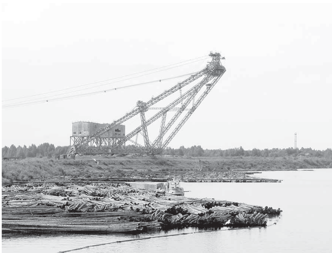
С каждым днём леса на воде остаётся всё меньше.

КОГДА ПРОХОДИШЬ ПО ПРЕДПРИЯТИЮ, ТО ЧАСТО ВСПОМИНАЕШЬ ИЗВЕСТНОЕ СТИХОТВОРЕНИЕ ДЖАННИ РОДАРИ «ЧЕМ ПАХНУТ РЕМЁСЛА?» У КАЖДОГО ДЕЛА ДЕЙСТВИТЕЛЬНО ОСОБЫЙ ЗАПАХ. В ЛЕСОСЫРЬЕВОМ ПРОИЗВОДСТВЕ ПОВСЮДУ ВИТАЕТ ДРЕВЕСНЫЙ ДУХ, ОСОБЕННО ОЩУТИМЫЙ ЛЕТОМ.