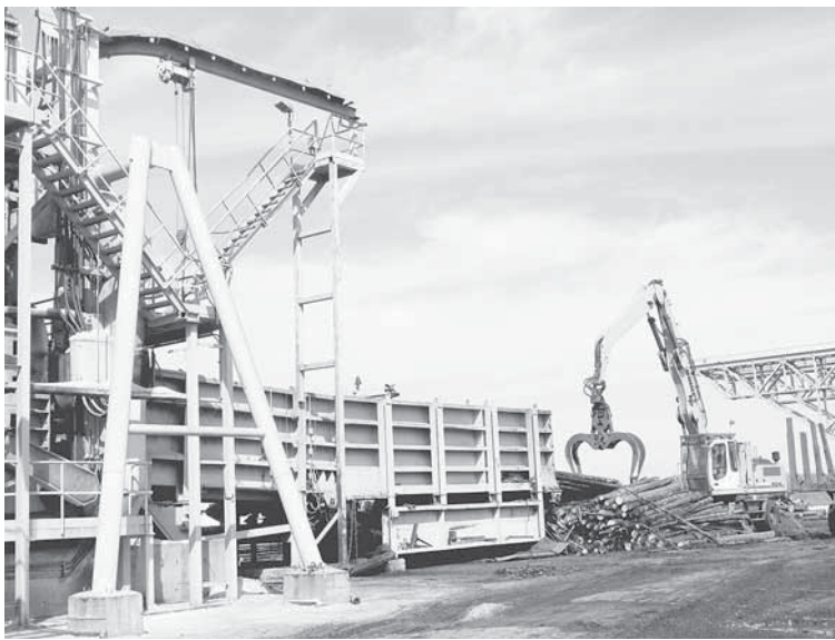
Погрузка разделанной хлыстовой древесины в лесовоз для последующей выкладки на штабель.

Во-вторых, у полиграфистов сегодня много новых