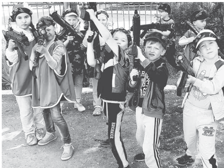
Лазертаг — это круто!

В этом году впервые в НДОУ ЦРР «Соликамскбумпром» осуществляла деятельность группа кратковременного пребывания детей «Летняя площадка».