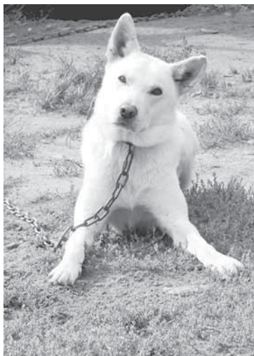
Кому — милашка, а кому — секьюрити!