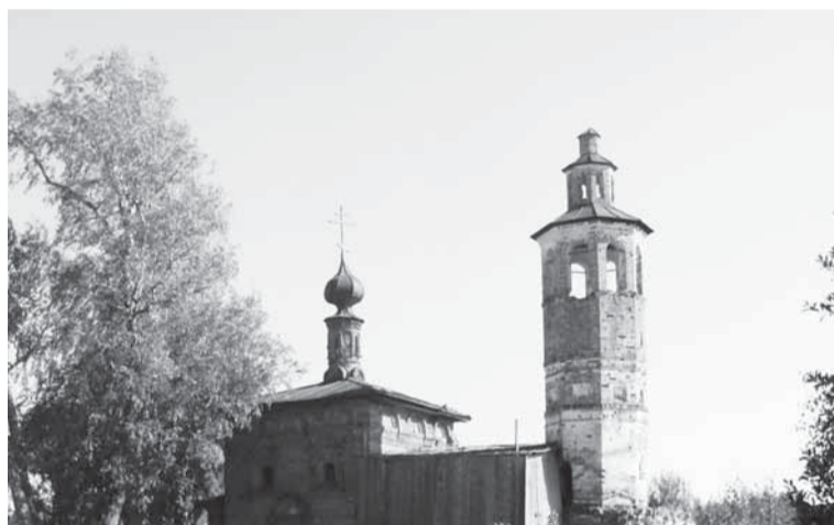
Крестовоздвиженская церковь в Верх-Боровой (построена в 1677 году).

Игорь Чечубалин, руководитель экспедиции.