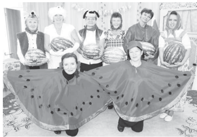
Каждой группе по арбузу!