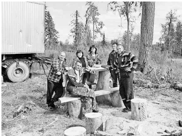
Обучение работников ЛЗО.