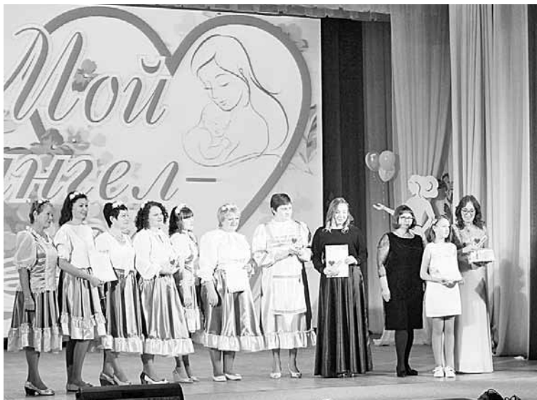
Участники и победители конкурса в номинации «Вокальное искусство»