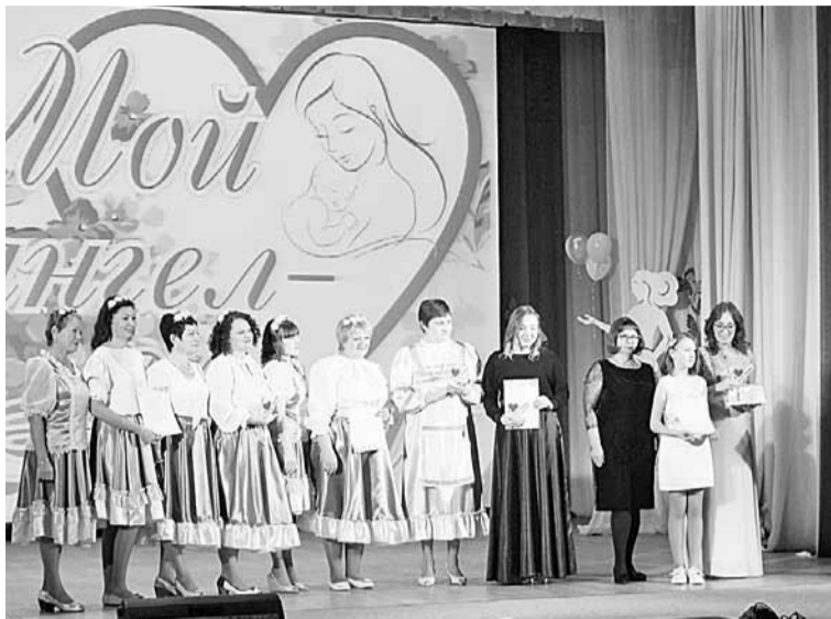
Участники и победители конкурса в номинации «Вокальное искусство»