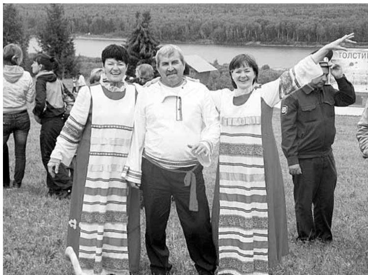
Им близки природа и народные традиции. На Толстиковской ярмарке.