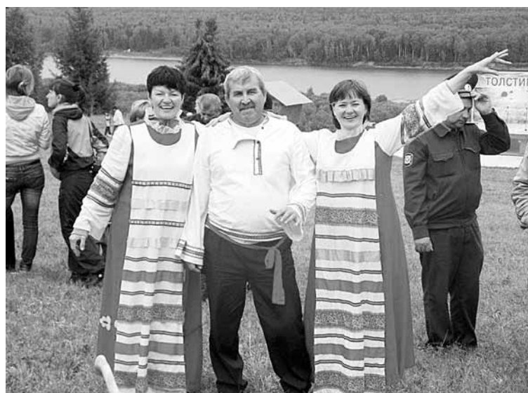
Им близки природа и народные традиции. На Толстиковской ярмарке.