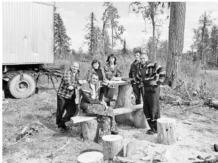
Обучение работников ЛПС.