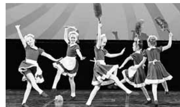
Выступает студия танца «БЭМС» ДК «Бумажник»

Один минус (который есть у многих танцевальных кол-