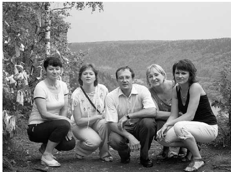
На Ветлане с аудиторами.