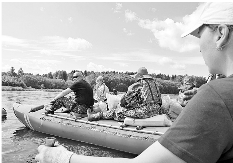
Туристы-водники поликлиники наслаждаются солнцем, ветром и речными просторами

Лето выдалось нынче не особо солнечное, прохладное, зато мало оводов, а немногочисленные мошки и комары не так сильно одолевают. Река Яйва, неглубокая, с перекатами и порогами, петляет среди холмов, поросших елями, пихтой, кедром. По берегам много камней-останцев и скал, которые делают реку очень живописной. Мы удивились, что за три дня сплава нам встретились только двое туристов. Оказалось из Челябинска. Поздно вечером они подплыли к нашей стоянке, изрядно промокшие. У нас был уже сварен борщ, заварен вкусный травяной чай, и, как гостеприимные хозяева, мы накормили промокших гостей.