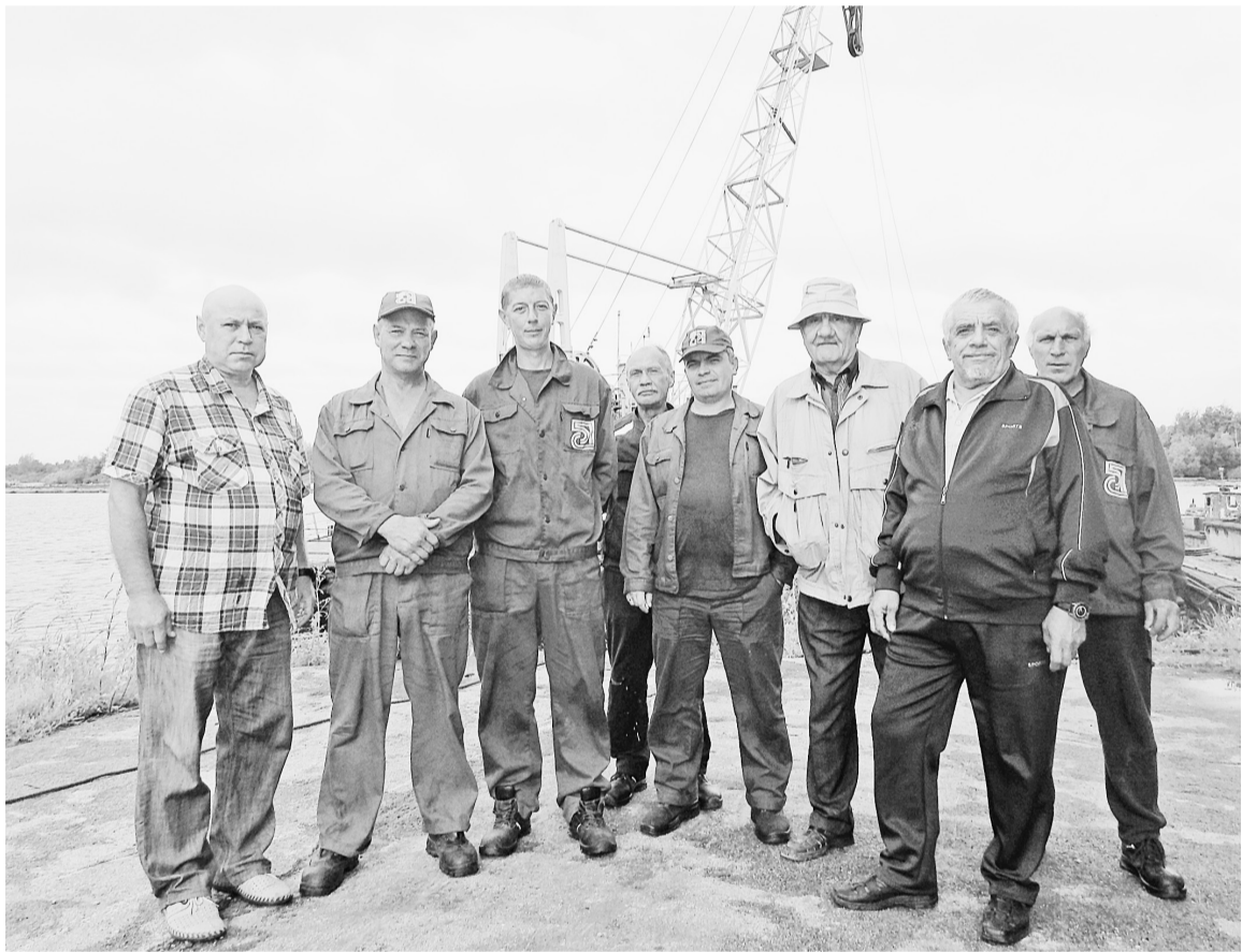
Наши речники перед утренней разрядкой

— Практически весь коллектив участка водного транспорта — это наши стажисты,