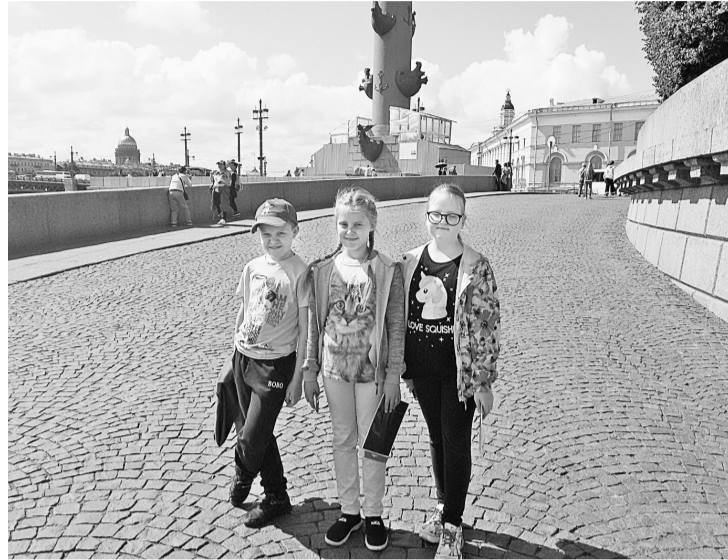
На Стрелке Васильевского острова

Около миллиона рублей выделило руководство АО «Соликамскбумпром» на поездку детей сотрудников предприятия в культурную столицу России.