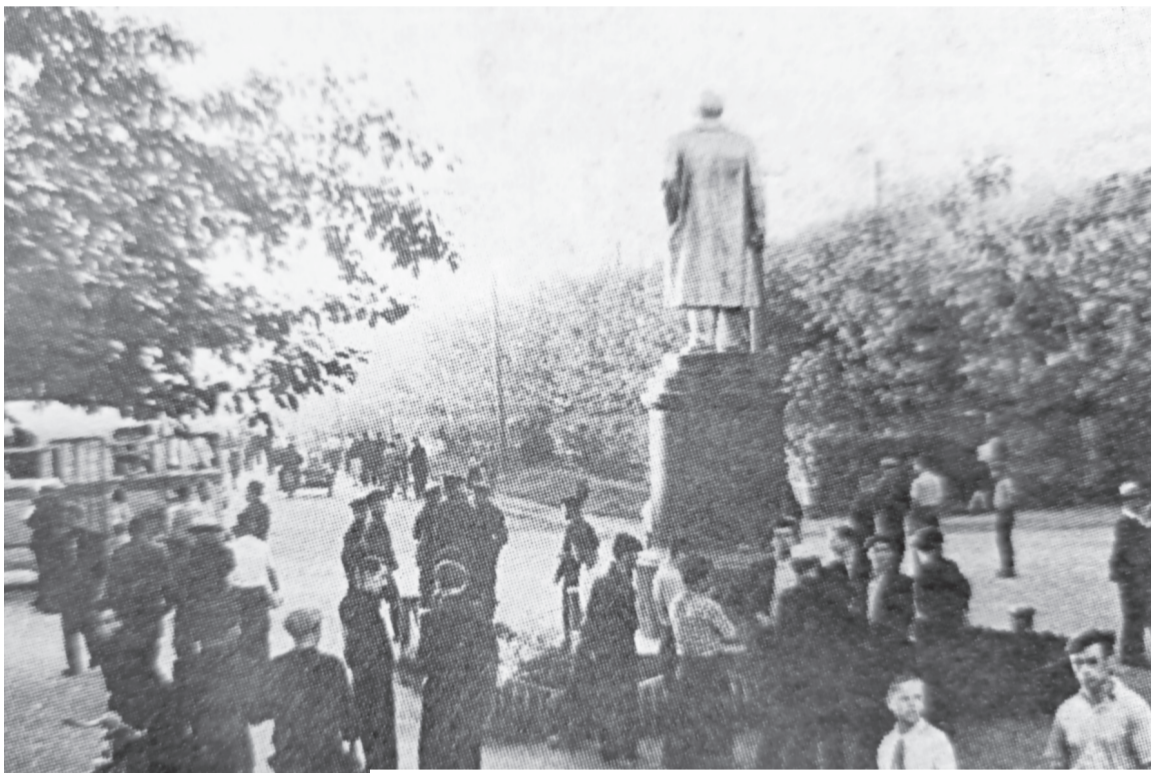
Перекрёсток улиц Сталина и Культуры

Некоторые из них позднее были переименованы: улица Ворошилова в Бумажников, Куйбышева в Ижевскую, Советская в Большевикскую, Чкалова