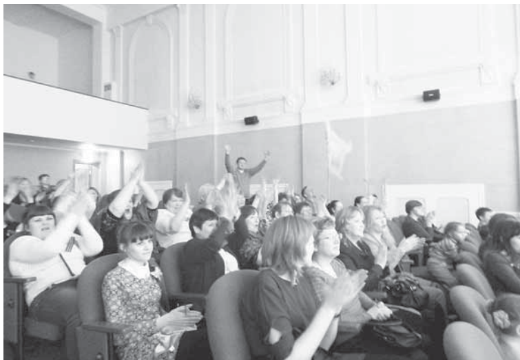
Команда болельщиков детского сада № 22, получившая приз от профкома за активную поддержку коллег.

тельно прожили на сцене маленькую жизнь, поэтому зрители забыли об условности реквизита и просто верили и сопереживали.