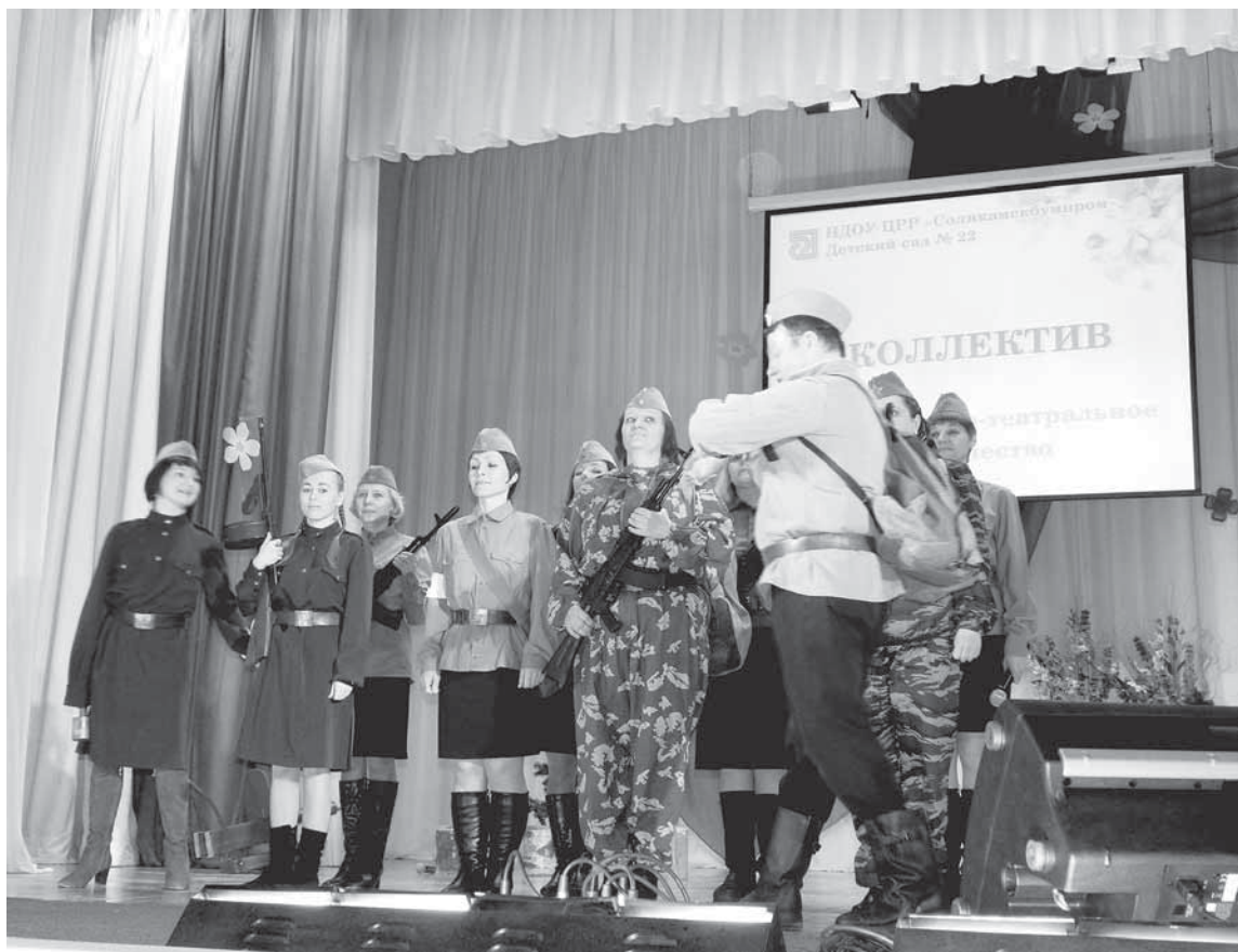
Театральная композиция «Зенитчицы» в исполнении коллектива сотрудников НДОУ «ЦРР «Соликамскбумпром» детский сад № 22.

ОТДЕЛ ПО СВЯЗЯМ С ОБЩЕСТВЕННОСТЬЮ НЕ СОМНЕВАЛСЯ, ОРГАНИЗУЯ ТВОРЧЕСКИЙ КОНКУРС «ЯРМАРКА ТАЛАНТОВ», ЧТО СРЕДИ РАБОТНИКОВ ОАО «СОЛИКАМСКБУМПРОМ» МНОГО ПО-НАСТОЯЩЕМУ ТАЛАНТЛИВЫХ ЛЮДЕЙ.