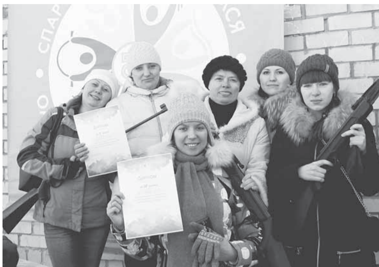
ОЛТК. Женские команды-победители.

обсуждениями, смехом и кричалками болельщиков. От некоторых подразделений участвовали несколько команд. Так, коллектив ЛСП оказался самым спортивным, от их подразделения участвовали в соревновании 3 команды. Сама атмосфера объединяла наших спортсменов, и каждый понимал, что главное —