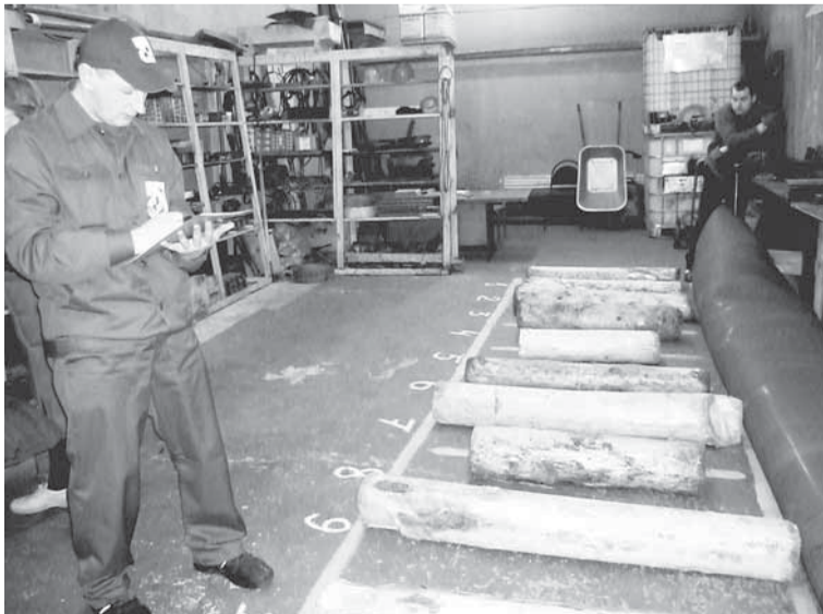
Определение качественного баланса для производства древесной массы.

Задание «Замена ножей на рубительной машине» — совсем не из лёгких. Труд очень тяжёлый физически! Операторы агрегатных линий сортировки и переработки брёвен выполняют дефектовку рубительных ножей (темп