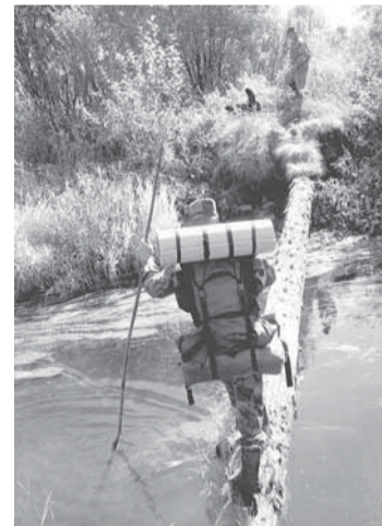
Переправа через реку Большой Сурмог.