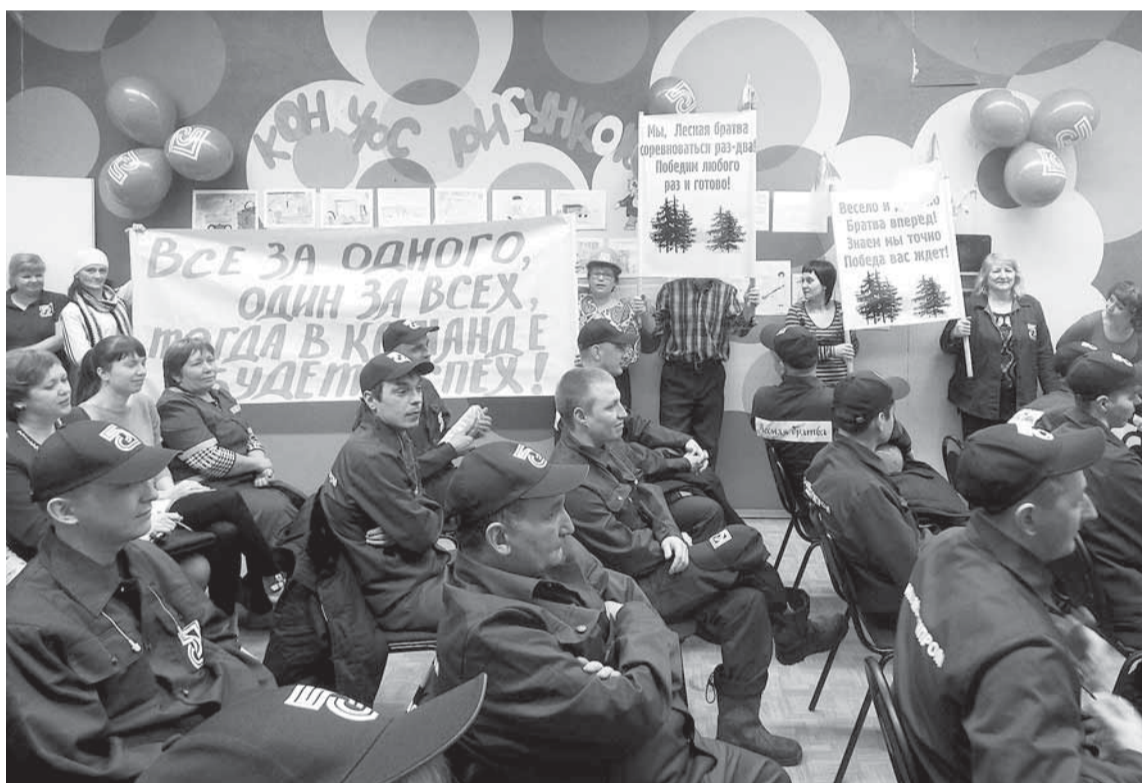
Теорию сдали. Впереди практический этап. Болельщики поддерживают конкурсантов.

ТОЛЬКО УСПЕЛИ ПОЗДРАВИТЬ КОЛЛЕКТИВ ЛЕСОСЫРЬЕВОГО ПРОИЗВОДСТВА С 75-ЛЕТНИМ ЮБИЛЕЕМ В ПРЕДЫДУЩЕМ НОМЕРЕ, КАК У НИХ ВНОВЬ СЕНСАЦИЯ — КОНКУРС ПРОФЕССИОНАЛЬНОГО МАСТЕРСТВА.