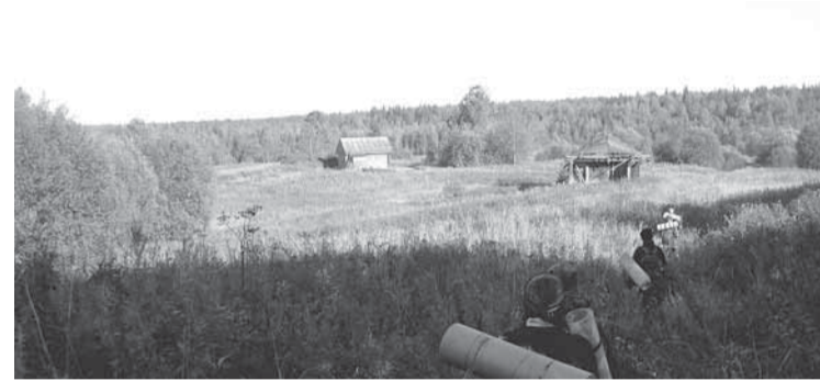
Бывшая деревня Ик.