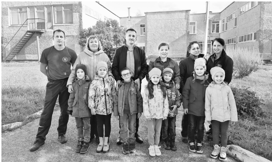
Вот они — самые активные участники!