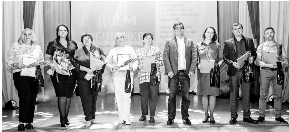
Федеральные, отраслевые и краевые награды вручил бумажникам министр промышленности и торговли Пермского края А. В. Чибисов

Федеральные, отраслевые и краевые награды заместитель председателя правительства Пермского края, министр промышленности и торговли Алексей Валерьевич Чибисов: