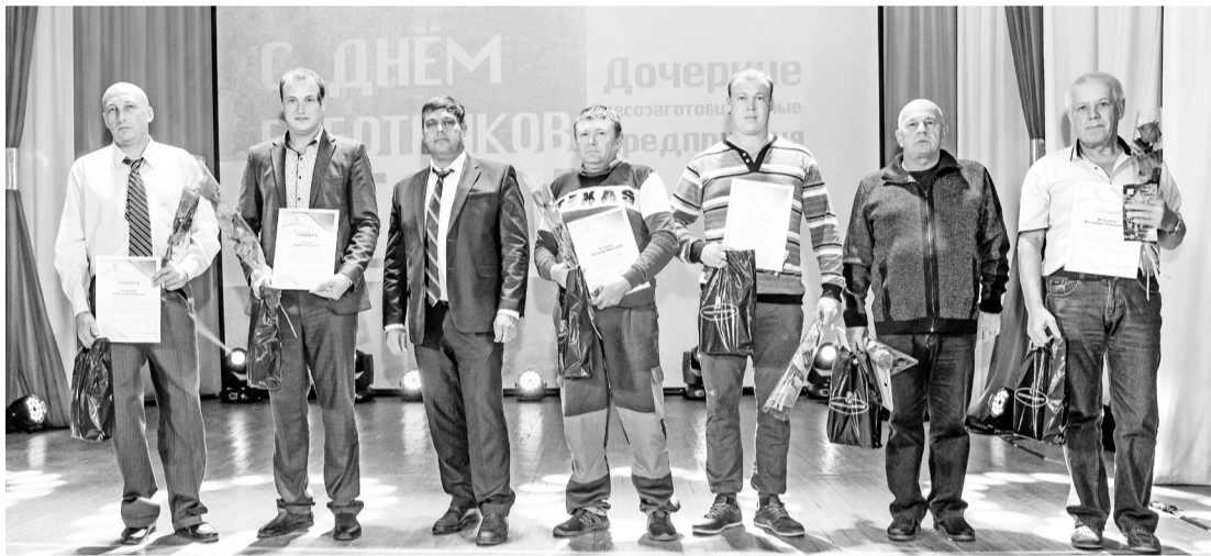
Наград и громких аплодисментов удостоены работники дочерних лесозаготовительных предприятий

Предприятие развивается, идёт постоянная модернизация производственного процесса.