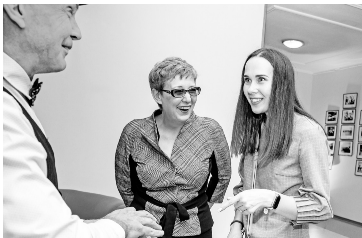
Талантливым розыгрышам фокусников гости вечера радовались как дети

— Бумажная река не кончается, несмотря на объективные трудности. В 2020 году ускоренными темпами мы освоили выпуск упаковочной бумаги — интерлайнера. Это резко укрепило наши позиции и расширило рынки сбыта. В 2021 году мы стали наращивать объёмы производства, а в 2022-м — увеличили, даже в сравнении с показателями «доковидной эпохи».