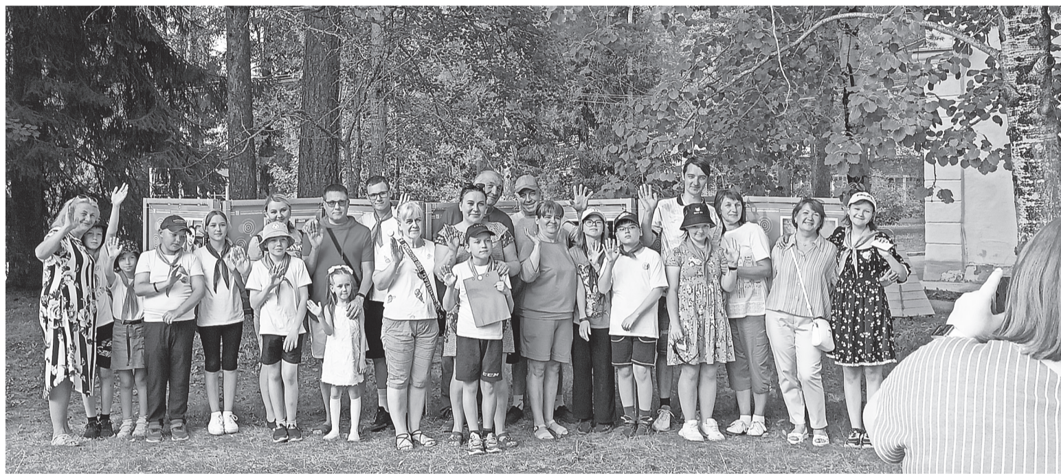
Общая фотография после церемонии открытия музея в «Лесной сказке»

Выходной день 30 июля выдался очень насыщенным для ребят смены «ПрофиБум» загородного лагеря отдыха и оздоровления детей «Лесная сказка». Успели открыть музей, принять гостей и сдать зачёт.