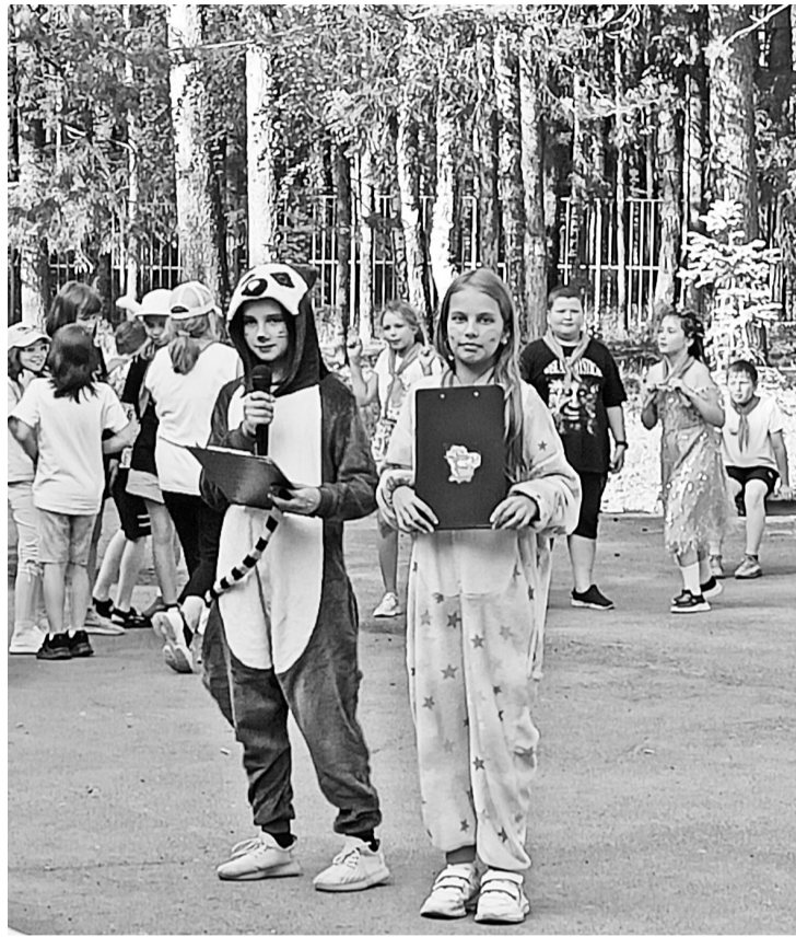
На творческом зачёте