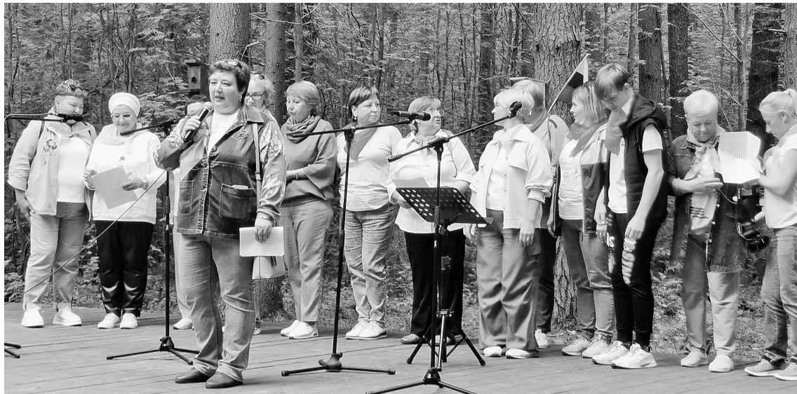
Выступление соликамцев в Добрянке

Волонтёрское движение объединяет не только территориально. Взаимопомощь, обмен опытом, порой, связывают крепкой дружбой людей из разных городов.