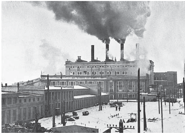
Соликамский целлюлозный бумажный комбинат. 1948 год.